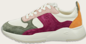
24131026 C491 cream peach Ramble | Pig Suede | LWG Leather | Nylon | Knit