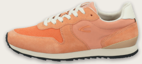
24138009 C494 orange multi Fog | Canvas | Cow Suede | LWG Leather