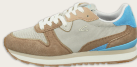
24133006 C482 almond Fog | Cow Suede | LWG Leather | Nylon