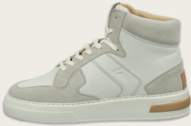
24131020 C29 white Lead | Cow Leather | Cow Suede

Diese Modelle haben wir für Sie ausgewählt: