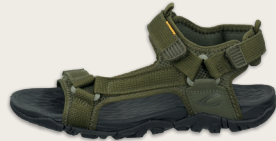
24167037 C731 green Treka | Mesh