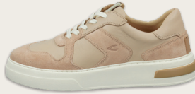
24131019 C229 nude Lead | Cow Leather | Cow Suede