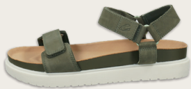
24164022 C77 olive Pad | Nubuck | LWG Leather