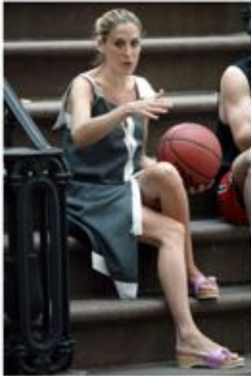
Sarah Jessica Parker

Stars und Influencer lieben Scholl und den Pescura.