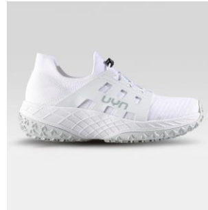
MAN Art. Y100414 / Farbe W000 WOMAN Art. Y100415 / Farbe W000