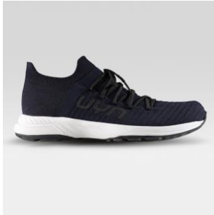
MAN Art. Y100376 / Farbe A928 WOMAN Art. Y100377 / Farbe A928