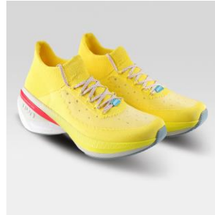
MAN Art. Y100398 / Farbe Y033 WOMAN Art. Y100399 / Farbe Y033