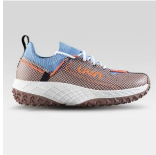
MAN Art. Y100341 / Farbe R496 WOMAN Art. Y100342 / Farbe R496