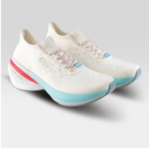
MAN Art. Y100394 / Farbe W000 WOMAN Art. Y100397 / Farbe W000