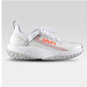
MAN Art. Y100412 / Farbe W000 WOMAN Art. Y100413 / Farbe W000