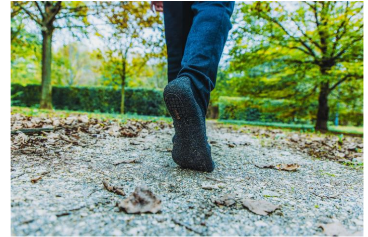
UNISEX Art. Y100333 / Farbe G461