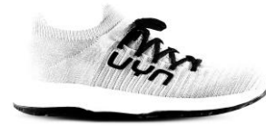
MAN Art. Y100376 / Farbe W000 WOMAN Art. Y100377 / Farbe W000