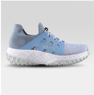
WOMAN Art. Y100415 / Farbe K515