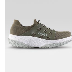
MAN Art. Y100414 / Farbe S001