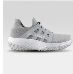
MAN Art. Y100414 / Farbe G248 WOMAN Art. Y100415 / Farbe G248