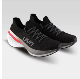
MAN Art. Y100389 / Farbe B000 WOMAN Art. Y100392 / Farbe B000