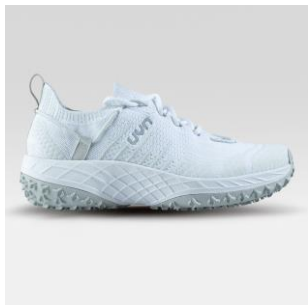
MAN Art. Y100269 / Farbe W000 WOMAN Art. Y100270 / Farbe W000