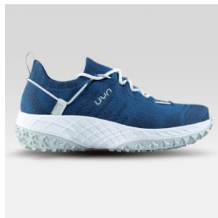
MAN Art. Y100269 / Farbe A075 WOMAN Art. Y100270 / Farbe A075