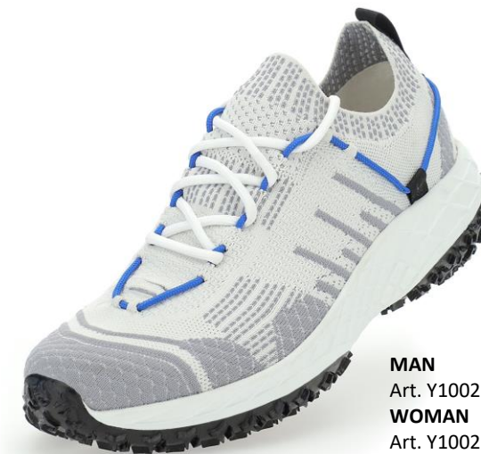
MAN Art. Y100220 / Farbe W068 WOMAN Art. Y100224 / Farbe W068