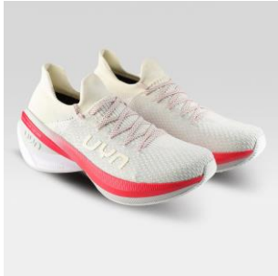
MAN Art. Y100390 / Farbe W148 WOMAN Art. Y100393 / Farbe W148