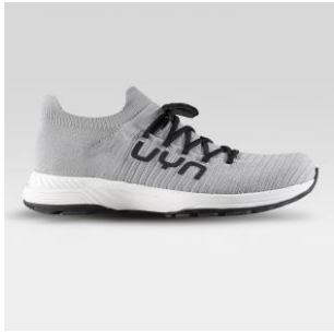
MAN Art. Y100376 / Farbe E831 WOMAN Art. Y100377 / Farbe E831