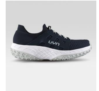
MAN Art. Y100414 / Farbe A075

alltagstaugliche Linie, kombiniert mit Funktion