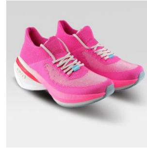
WOMAN Art. Y100400 / Farbe P249