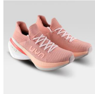
WOMAN Art. Y100391 / Farbe P042