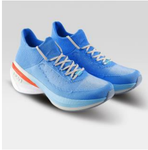
MAN Art. Y100394 / Farbe A287