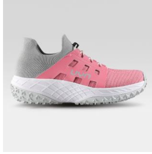
WOMAN Art. Y100415 / Farbe P042