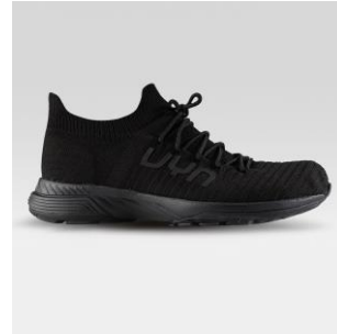
MAN Art. Y100381 / Farbe B000 WOMAN Art. Y100382 / Farbe B000