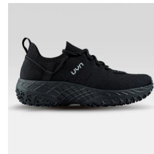
MAN Art. Y100271 / Farbe B000 WOMAN Art. Y100272 / Farbe B000