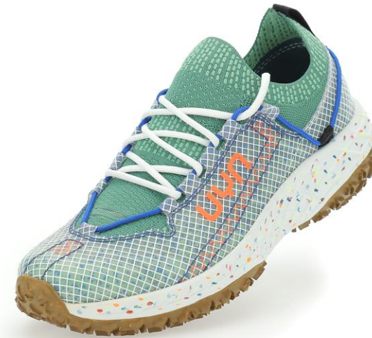
MAN Art. Y100221 / Farbe E017 WOMAN Art. Y100225 / Farbe E017