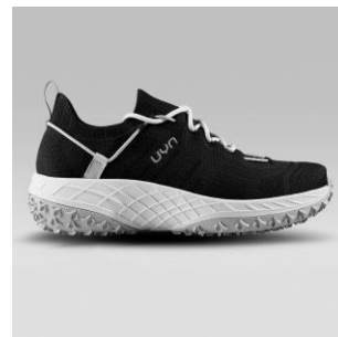
MAN Art. Y100269 / Farbe B000 WOMAN Art. Y100270 / Farbe B000