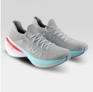
MAN Art. Y100388 / Farbe S010