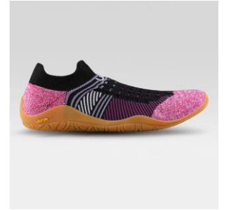
UNISEX Art. Y100416 / Farbe G142