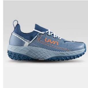
MAN Art. Y100343 / Farbe A075 WOMAN Art. Y100344 / Farbe A075