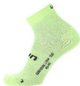
E646 Acid Lime