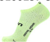
E646 Acid Lime