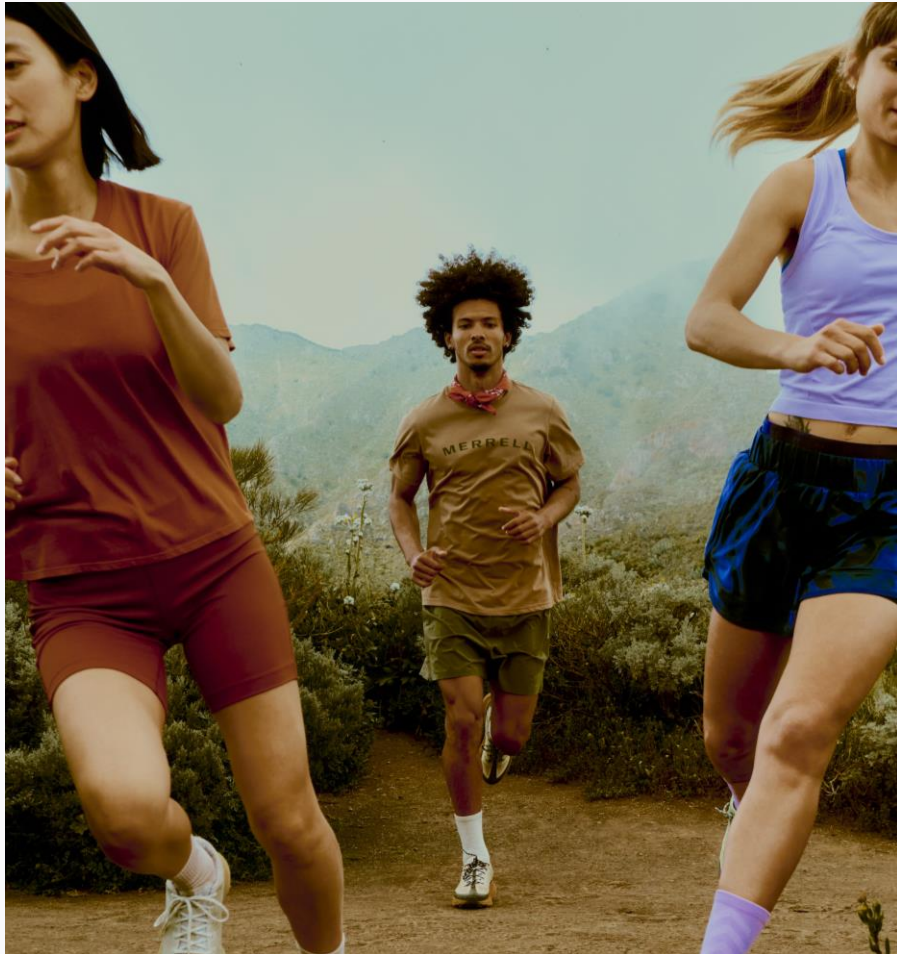
Vielseitiger Schuhe für Lauf-, Walking- und Wanderabenteuern auf unterschiedlichem Terrain. VK: 135€ / 150€ WP