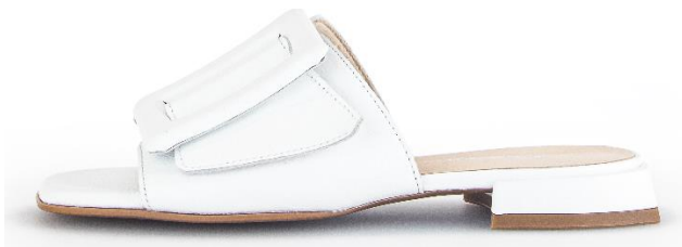
Weißer Pantolette mit markanter, lederbezogener Zierspange 42.803.50

Weiß, Dunkelblau und Schwarz sind mengenmäßig die wichtigsten Farben.