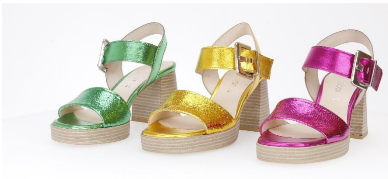
Sandaletten in kräftigen, schimmernden Farben (Modell 44.780)

Neue kräftige Farben und mehr Eleganz – so kann man die Damenschuhmode der Saison F/S 2024 in wenigen Worten zusammenfassen. Sportivität ist weiterhin sehr wichtig, gleichzeitig hat die Nachfrage nach moderner Business- und Anlassmode spürbar angezogen. Die neuen Powerfarben sind Orange, Apfelgrün, Feuerrot, Lila und Kobaltblau.