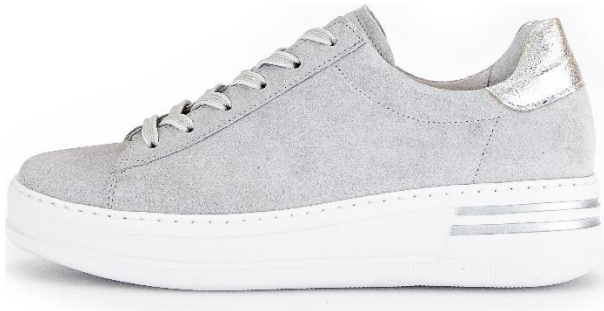
Gabor Sneaker in ruhiger Farbzusammenstellung in Mehrweite und mit Schalensohle 46.395.40

An der Ferse hochgezogene Sohlen, Akzentsenkel mit unterschiedlichen Farben oder Tube-Senkel sind weitere Details.