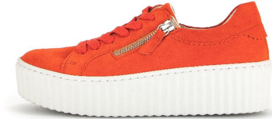
Sneaker in kräftigem Orange-Ton, seitliche Zips für komfortables Anziehen 43.200.35

Neu und frisch wirken Sneakers in den „Powerfarben“, ruhigere Farbvarianten in Hell und Natur sind sehr edel. Sneaker ganz in Weiß bleiben wichtig.