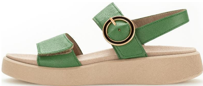
Sandalette in kräftigem Grünton, kombiniert mit super-softer naturfarbener Sohle. Klettverschlüsse zur individuellen Weiten-Regulierung 42.863.54

Bei allen Sandaletten und Pantoletten bietet Gabor hervorragenden Komfort, z.B. durch verstellbare Klett-Oberteile, weiche gepolsterte Fußbetten, flexible Sohlen und zum Teil sogar durch wechselbare Fußbetten.