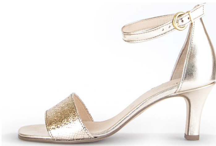
Elegante Sandalette in Gold mit geschlossener Ferse 41.890.62