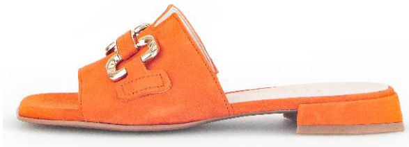
Flats in Orange mit schönem Schmuck mit flexibler Sohle 42.802.32

Auch bei den Pantoletten sorgen Klettverschlüsse für eine Top-Passform bei kräftigeren, aber auch bei schmaleren Füßen.