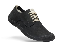
BLACK/BLACK HERREN 1026459