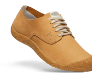
APPLE CINNAMON/BIRCH DAMEN 1026457