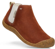
TORTOISE SHELL/BIRCH DAMEN 1026826