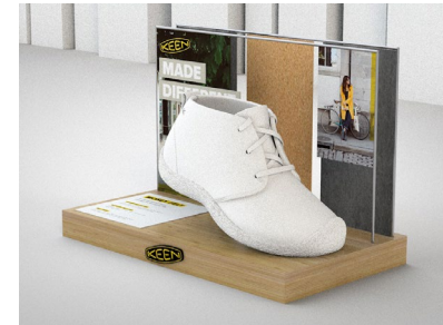
TABLE DISPLAY: PREMIUM WOOD/CORK/GUM/LEATHER VERSION