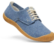
BLUE FELT/BIRCH DAMEN 1026450