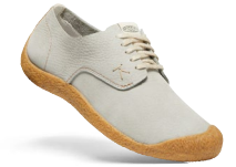
VAPOR/BIRCH DAMEN 1026458