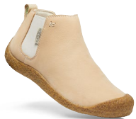
SAFARI/BIRCH DAMEN 1026453