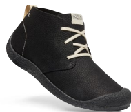
BLACK/BLACK HERREN 1026461