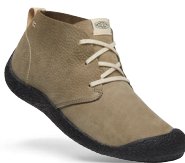
DARK OLIVE/BLACK HERREN 1026462