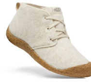
NATURAL FELT/BIRCH DAMEN 1026447