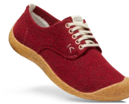
RED FELT/BIRCH DAMEN 1026809