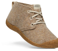
TAUPE FELT/BIRCH DAMEN 1026446