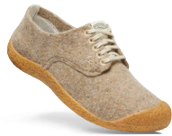
TAUPE FELT/BIRCH DAMEN 1026449