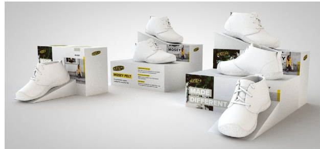
TABLE DISPLAY: MODULAR FOLDABLE CARD VERSION