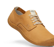
APPLE CINNAMON/BIRCH HERREN 1026460