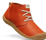
POTTERS CLAY/BIRCH HERREN 1026463