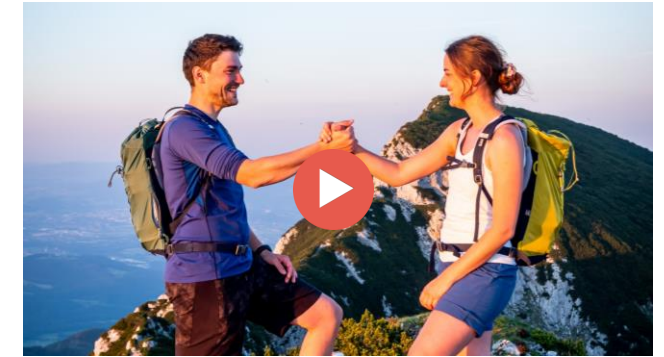
Videos für Shop TV

Faltblatt / Poster A2 Vorderseite (zur Deko) – Rückseite zur Info