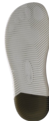
WOMEN'S KNX LACE SKU 1028355 BLACK / STAR WHITE