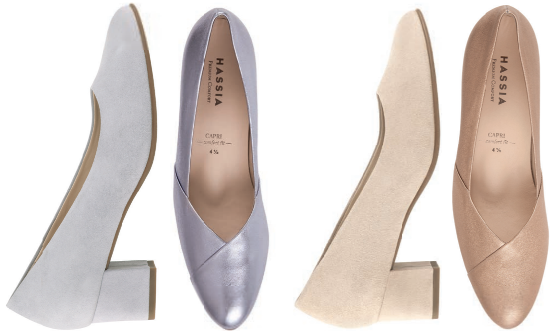
Capri — comfort fit —