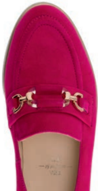
Pisa — comfort fit —

in zwei Weiten erhältlich – available in two widths