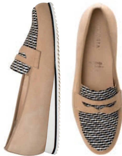
Piacenza — comfort fit —