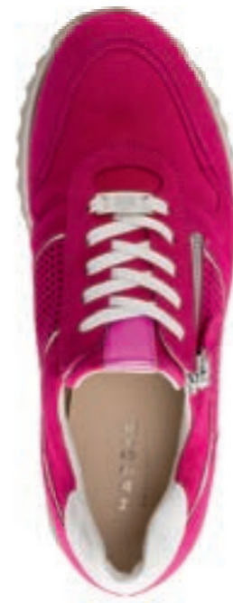
Porto — comfort fit —