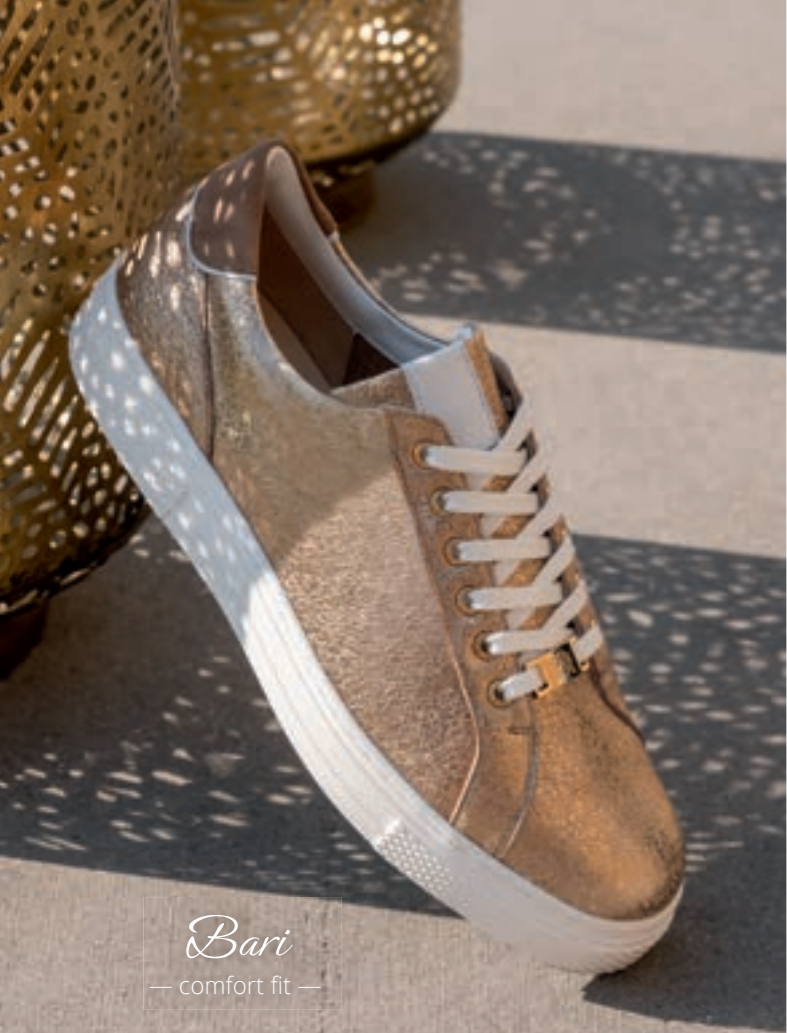
Bari — comfort fit —