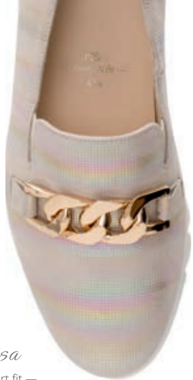
Pisa — comfort fit —