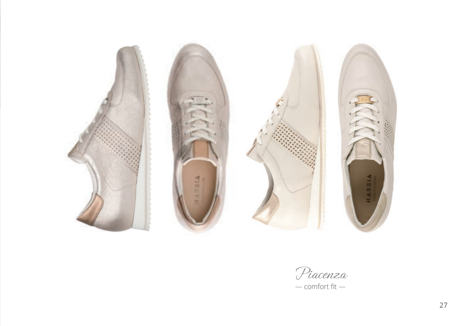
Piacenza — comfort fit —