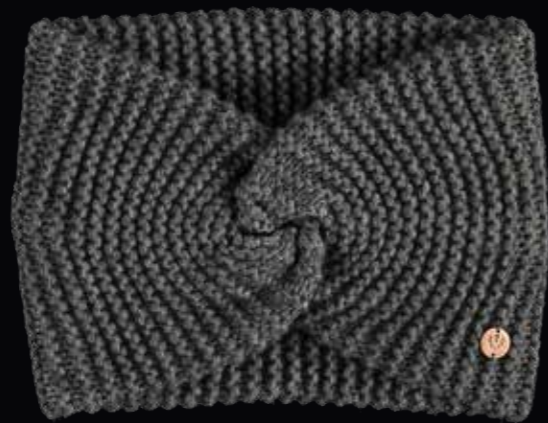
684.007 980 80% WOOL, 20% CASHMERE ONE SIZE 59,95 EUR