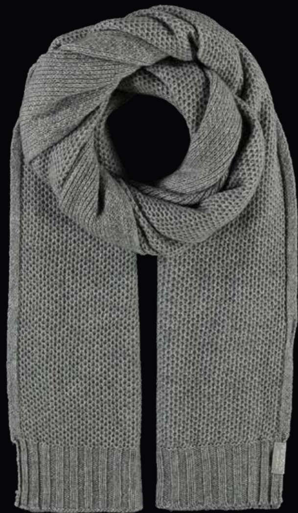
684.005 960 80% WOLLE, 20% CASHMERE 50 X 180 CM 149,00 EUR