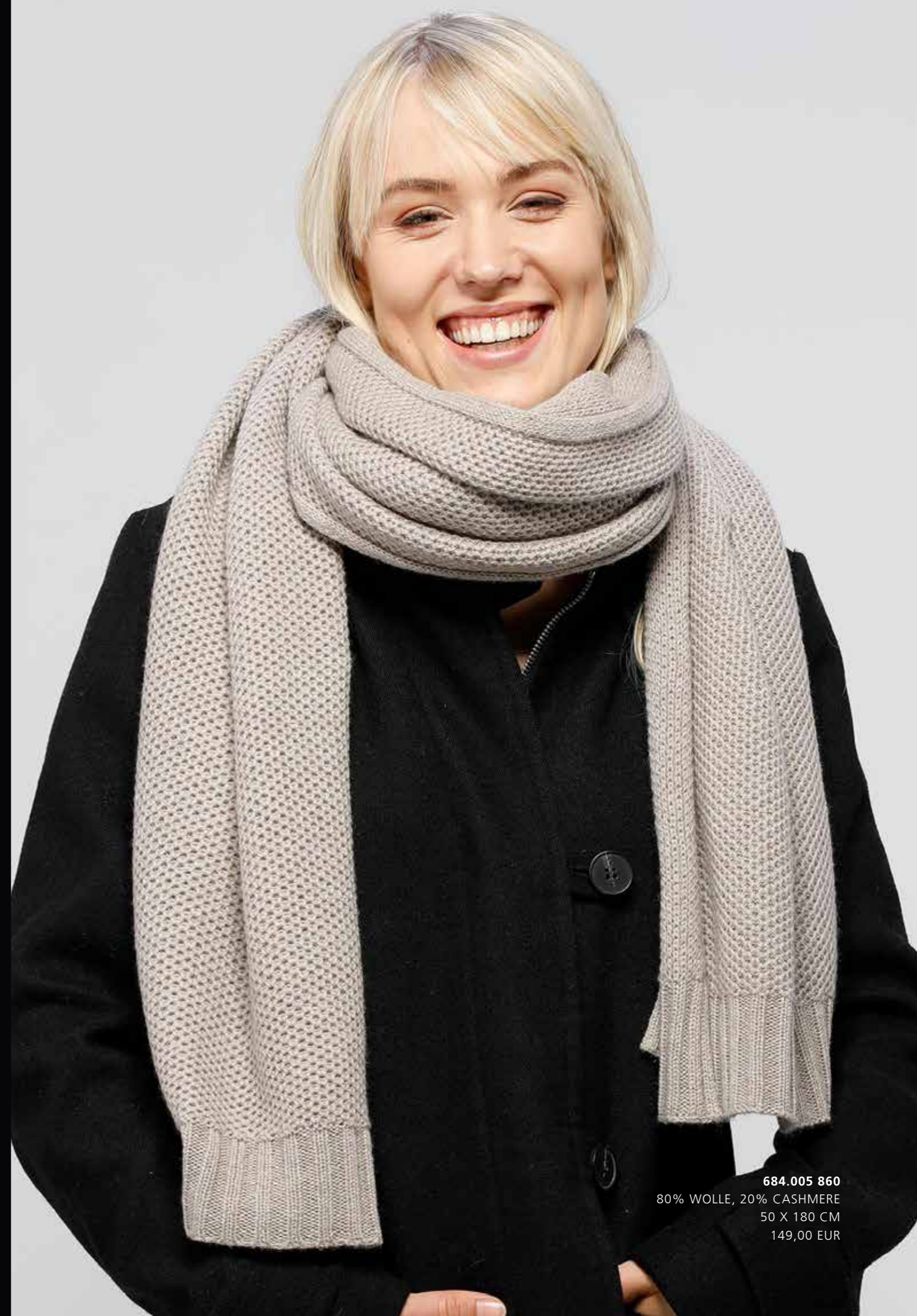
684.005 860 80% WOLLE, 20% CASHMERE 50 X 180 CM 149,00 EUR