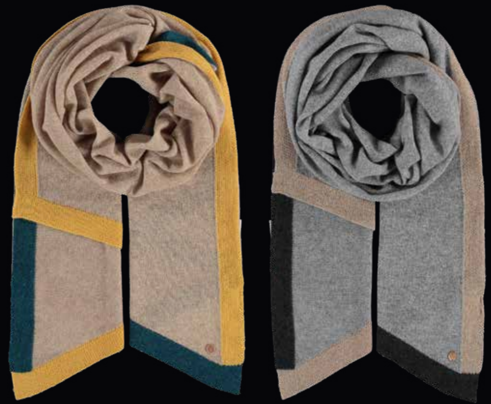
684.008 860, 960 100% WOOL 65 X 180 CM 169,00 EUR