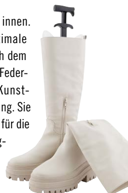
Art.-Nr.: 9574002 (S); 9574003 (L); 9564002 (S); 9564003 (L)

Schaffformer sind die perfekte Stiefelpflege von innen. Sie sorgen für knickfreie Stiefelschäfte, für optimale Luftzirkulation und Trocknung des Fußbereichs nach dem Tragen. Unsere Bergal Boot Shaper mit Memory-Federelement und aus recycelbaren transparenten Kunststoff-Schalen sind denkbar einfach in der Handhabung. Sie passen sich an jeden Stiefelschaft an und sind ideal für die hängende oder stehende Aufbewahrung aller Langschaft-Stiefel – ein Must-Have für Stiefelliebhaber.