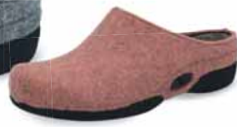
01553-706 altrosé • Filz antique rosé • felt vieux rosé • feutre