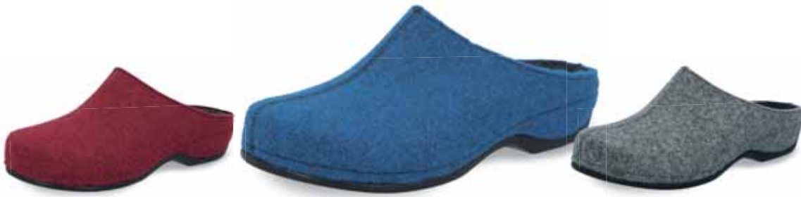
01025-258 dunkelrot • Filz dark red • felt rouge foncé • feutre