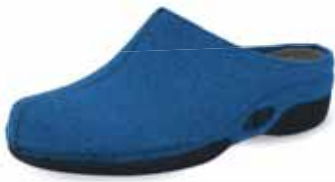
01553-312 royalblau • Filz royal blue • felt bleu royal • feutre