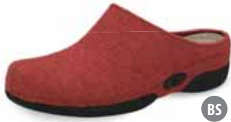
01553-235 rot • Filz red • felt rouge • feutre