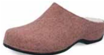
01025-706 altrosé • Filz antique rosé • felt vieux rosé • feutre

Fußbett mit Bezug aus Schurwolle Footbed with virgin wool cover Lit plantaire avec housse en laine vierge