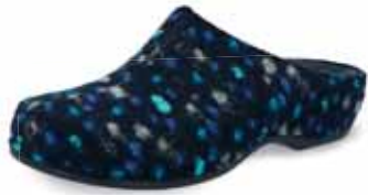
01028-325 TOP blau/tiefblau/Tupfen • Filz blue/deep blue/dots • felt bleu/bleu profond/à points • feutre