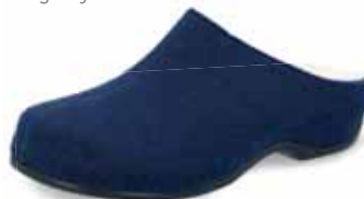
01025-350 TOP dunkelblau • Filz dark blue • felt bleu foncé • feutre

Fußbett mit Bezug aus Schurwolle Footbed with virgin wool cover Lit plantaire avec housse en laine vierge