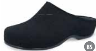
01025-958 schwarz • Filz black • felt noir • feutre