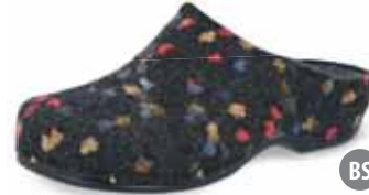
01028-914 grau/Tupfen • Filz gray/dots • felt gris/à points • feutre