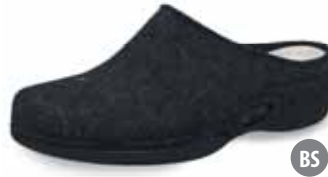
01553-937 dunkelgrau • Filz dark gray • felt gris foncé • feutre