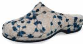
01028-165 blau/altweiß/Tupfen • Filz blue/antique white/dots • felt bleu/vieux blanc/à points • feutre Fußbett mit Bezug aus Schurwolle Footbed with virgin wool cover Lit plantaire avec housse en laine vierge