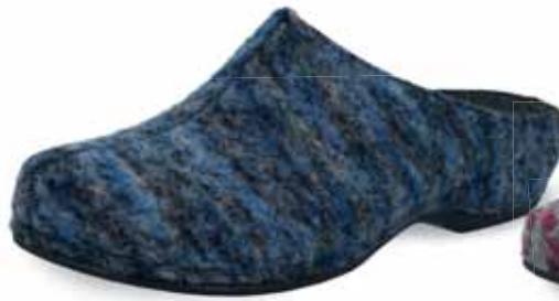
01028-393 eisblau/blau • Filz ice blue/blue • felt bleu glacier/bleu • feutre