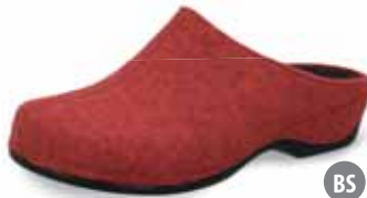
01025-235 rot • Filz red • felt rouge • feutre