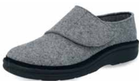
05727-652 hellgrau • Filz light gray • felt gris clair • feutre