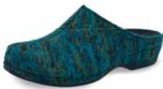
01028-391 eisblau/grün • Filz ice blue/green • felt bleu glacier/vert • feutre