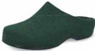
01025-782 waldgrün • Filz forest green • felt vert forêt • feutre