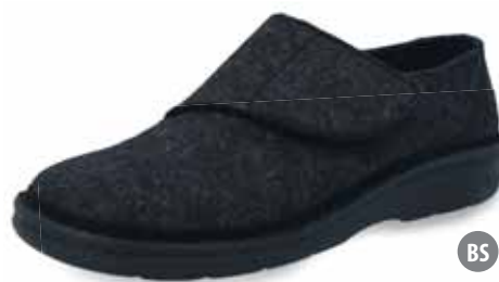
05727-937 dunkelgrau • Filz dark gray • felt gris foncé • feutre