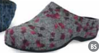
01028-645 hellgrau/Tupfen • Filz light gray/dots • felt gris clair/à points • feutre