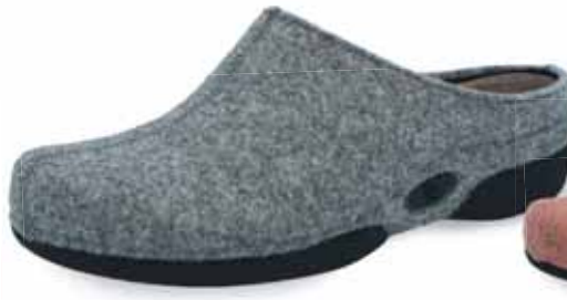
01553-652 TOP hellgrau • Filz light gray • felt gris clair • feutre