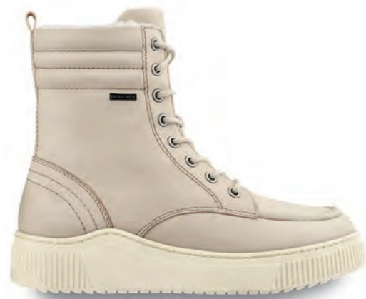
LACE-UP BOOT 86220-29 413

Shoe comfort says more than a thousand words! The warm lining styles feature a particularly impressive soft lining, flexible, supple leather and robust soles. The Duo-Tex membrane protects against wet and cold. Conversely, moisture is expelled from the shoe as water vapour. This breathable function keeps feet warm and dry.