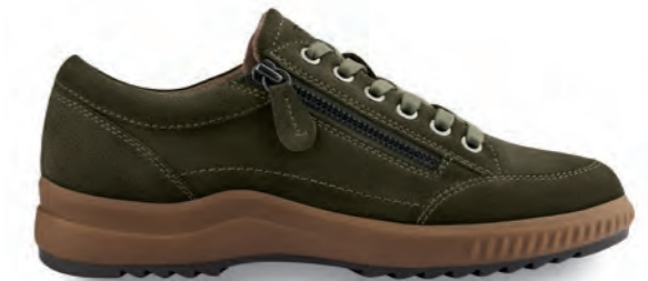
LACE-UP 83706-29 707