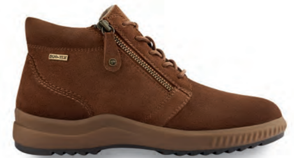
LACE-UP BOOT 86205-29 305