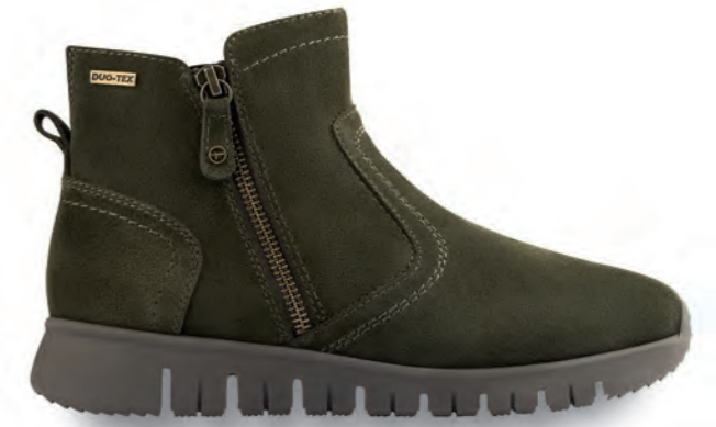
BOOT 86402-29 707