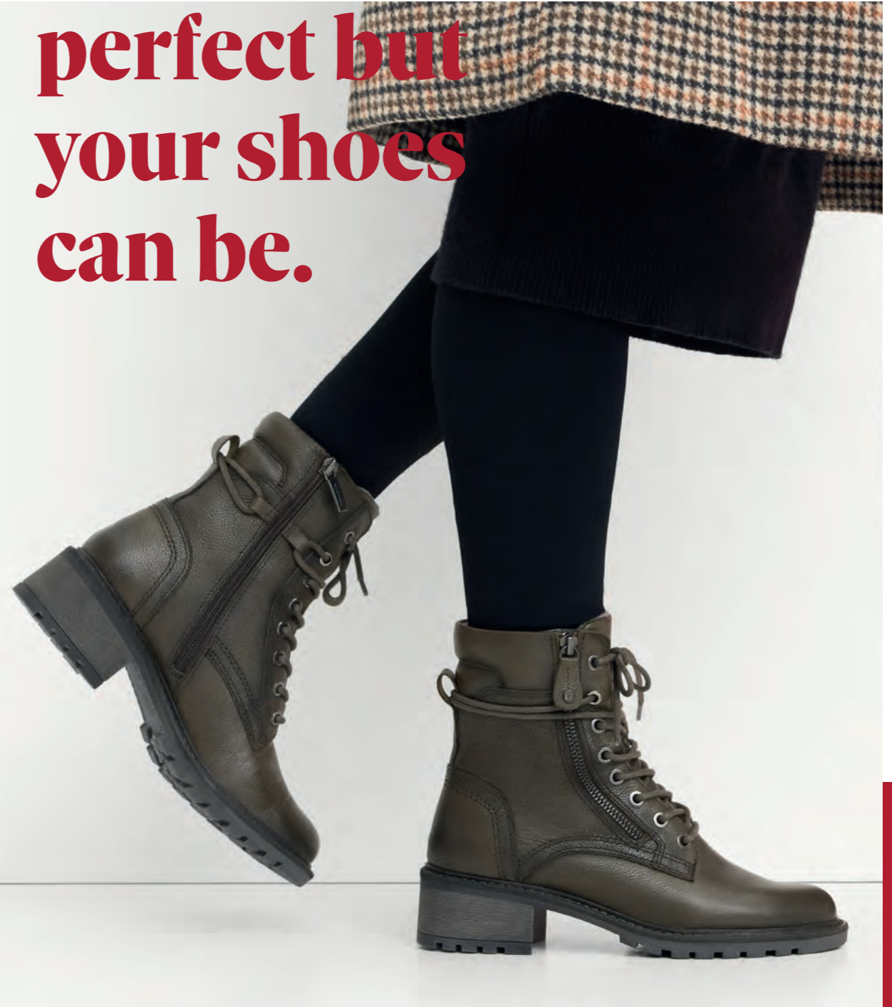
left CHELSEA BOOT 85404-29 001 | right LACE-UP BOOT 85207-29 707

Life isn't perfect but your shoes can be.