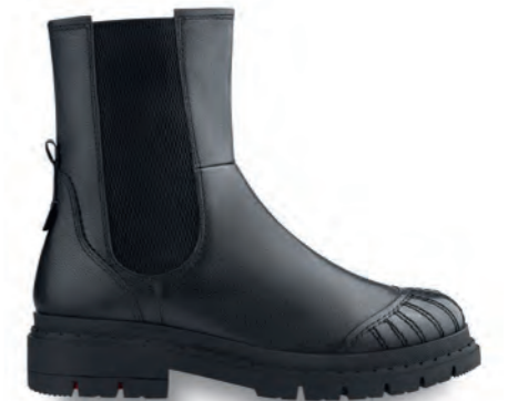
CHELSEA BOOT 85408-29 001