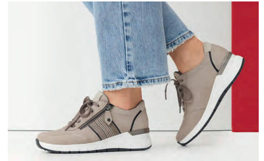
SNEAKER 83701-29 348