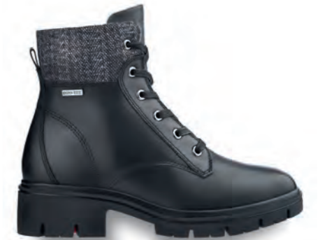
LACE-UP BOOT 86213-29 001