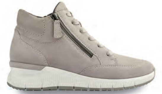
HIGH-TOP SNEAKER 85209-29 204