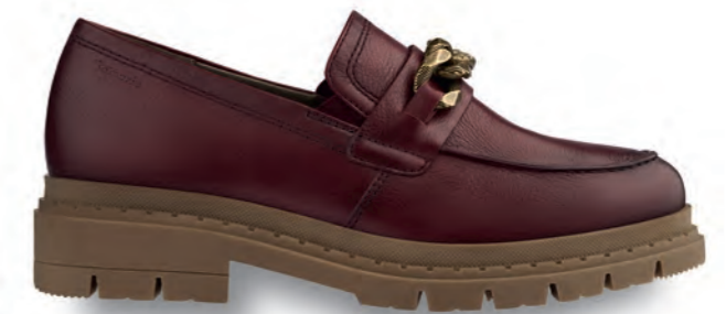
LOAFER 84703-29 540

Sometimes a shoe can be an everyday saviour: it upgrades any outfit, supports us on comfortable soles and impresses with its look. Modern details create the perfect performance.