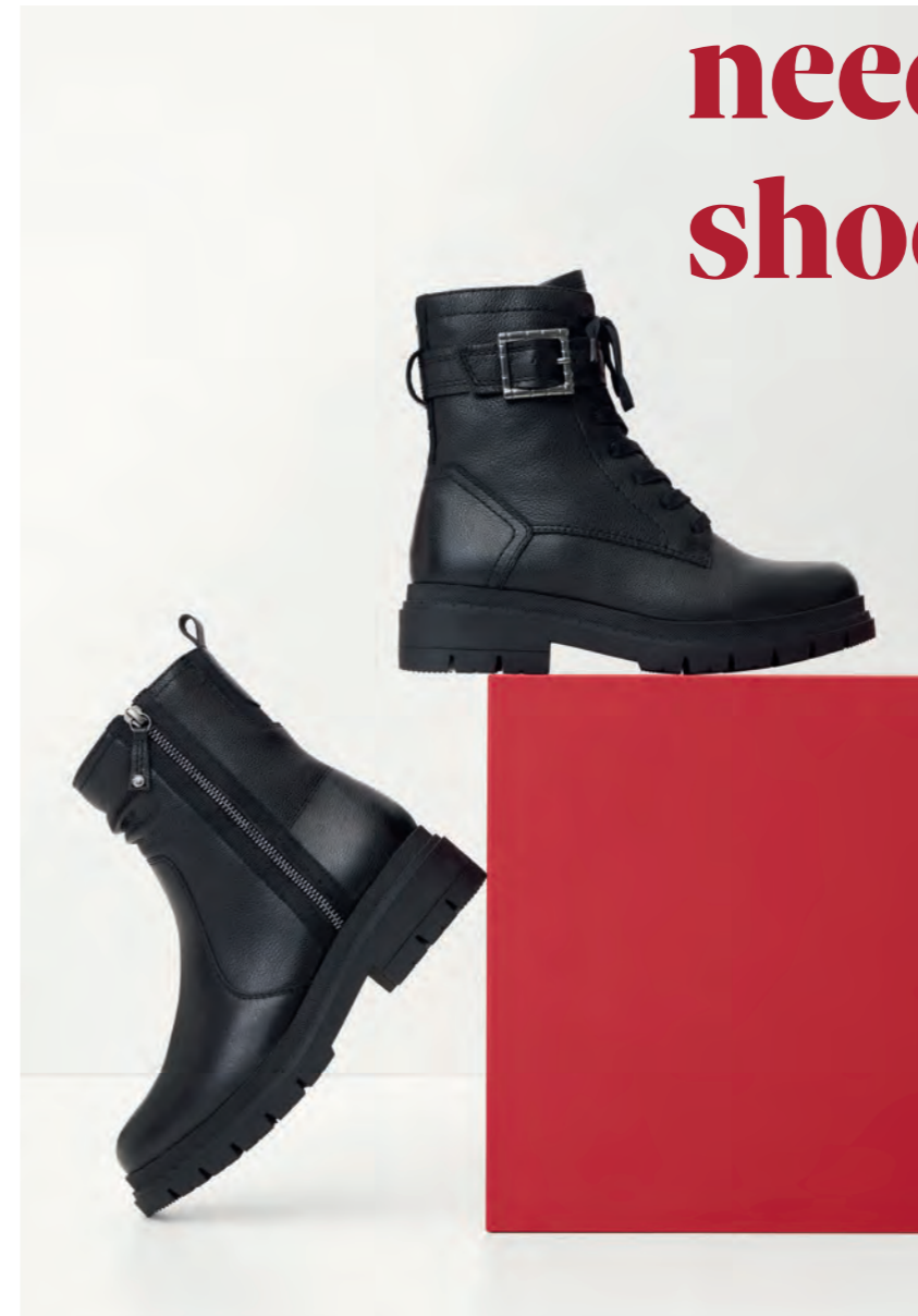
top LACE-UP BOOT 85211-29 001 | left BOOT 85407-29 001

Ein gutes Paar Schuhe sollte genügend Bewegungsfreiheit haben und den Füßen Entspannung und Entlastung im Alltag ermöglichen. Darüber hinaus bieten elastische Stretch-Einsätze am Schaft jeder Frau eine individuelle Weitenanpassung und genügend Halt.