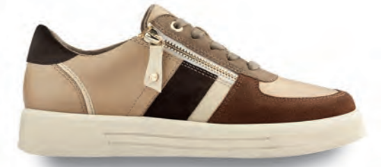
SNEAKER 83700-29 490

It's much easier to live in comfort! Our all-round feel-good package is based on details like sporty styles, an additional functional zip, soft materials and an ergonomic footbed. All day long.