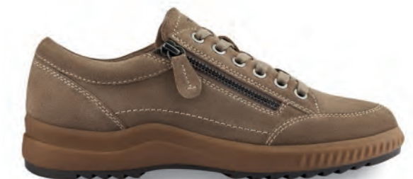
LACE-UP 83706-29 341

Komfortschuhe zu entwickeln ist unsere Mission. Frauen ein Lächeln ins Gesicht zu zaubern, ist unsere größte Motivation. Dabei achten wir besonders auf ausgesuchte Materialien und eine hochwertige Verarbeitung, um die bestmögliche Passform zu erzielen.