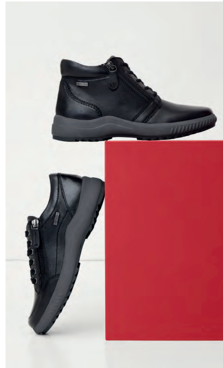
top LACE-UP BOOT 86205-29 022 | left LACE-UP 83707-29 001