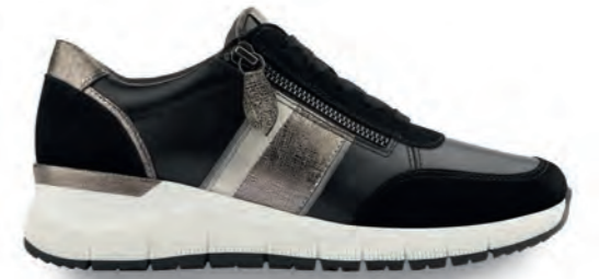
SNEAKER 83701-29 001