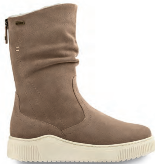
LONG BOOT 86418-29 341