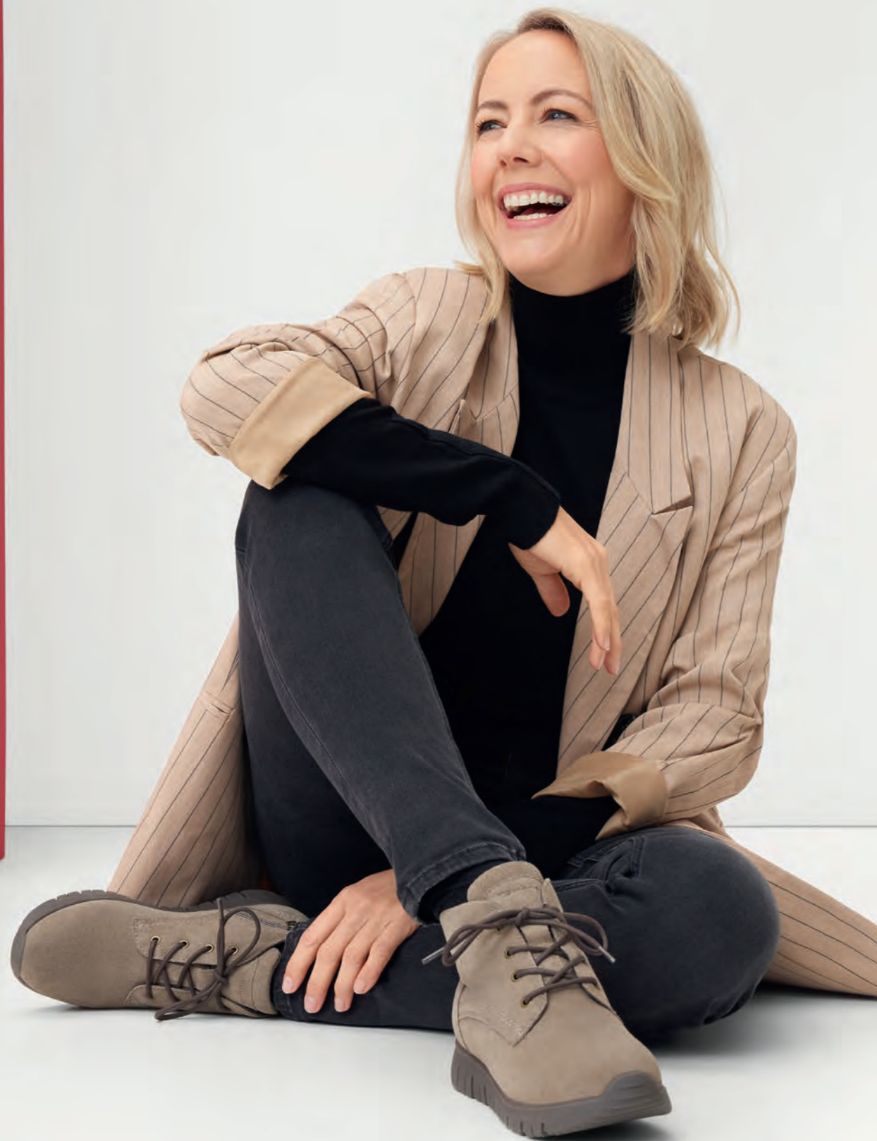
LACE-UP BOOT 86204-29 341