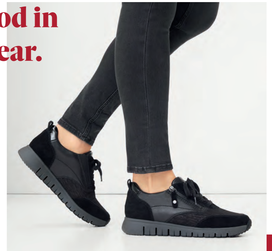
SNEAKER 83705-29 001

Our secret: the comfort of our collection comes from every not so little detail. The specially developed, flexible outer sole creates a pleasant and light walking experience and gives the foot enough room where it rolls, supporting its natural movement.