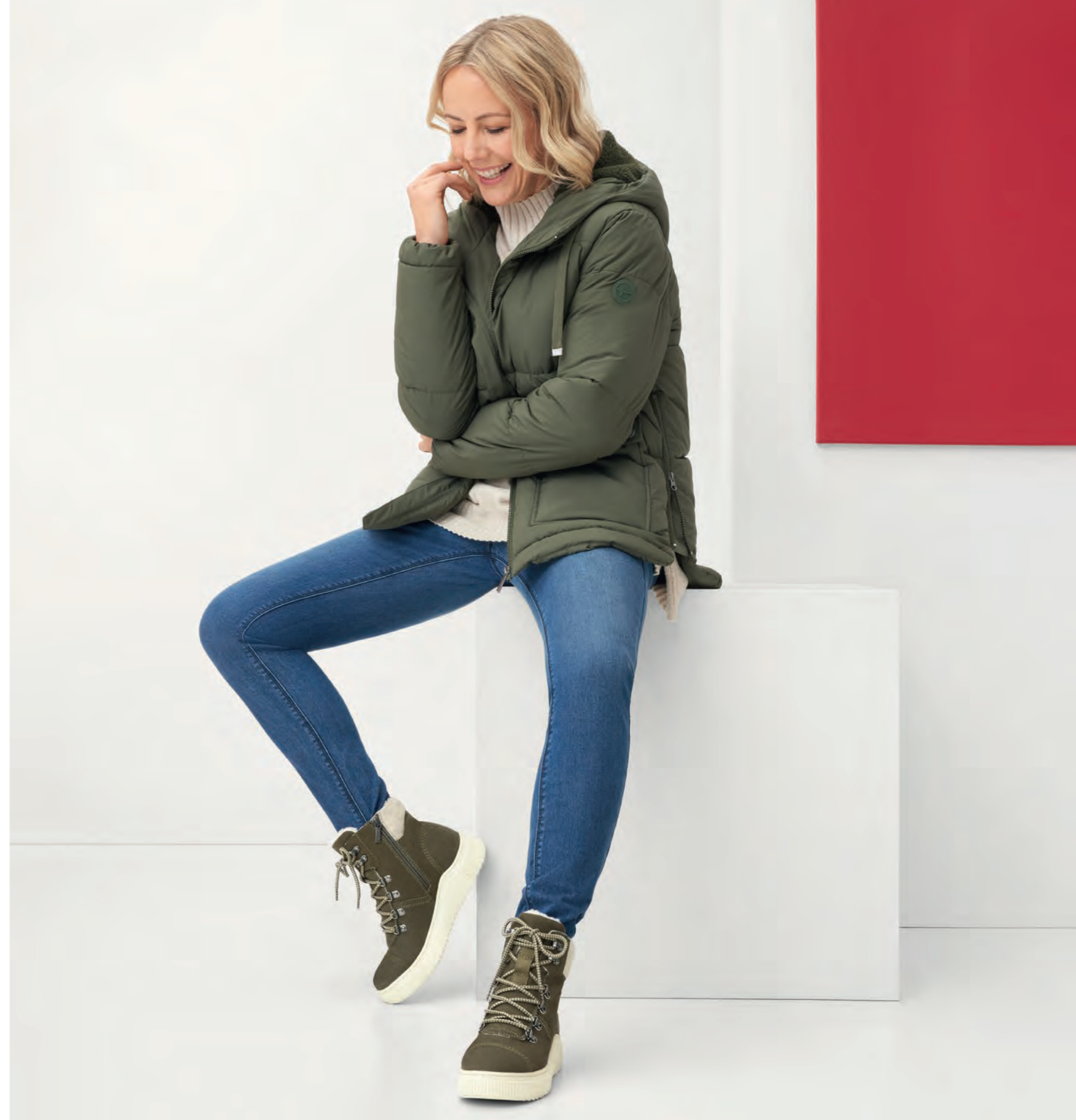
LACE-UP BOOT 86219-29 707