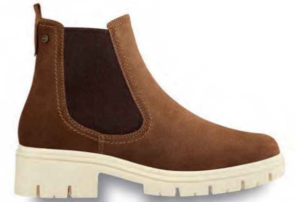
CHELSEA BOOT 85403-29 305

The Tamaris Comfort styles simply put wearers in a good mood and guarantee that every woman can enjoy all-round comfort. Besides innovative technologies like Comfort Fit, this is due to the functional Duo-Tex materials and robust soles with grip effect. The perfect companion for that next adventure.