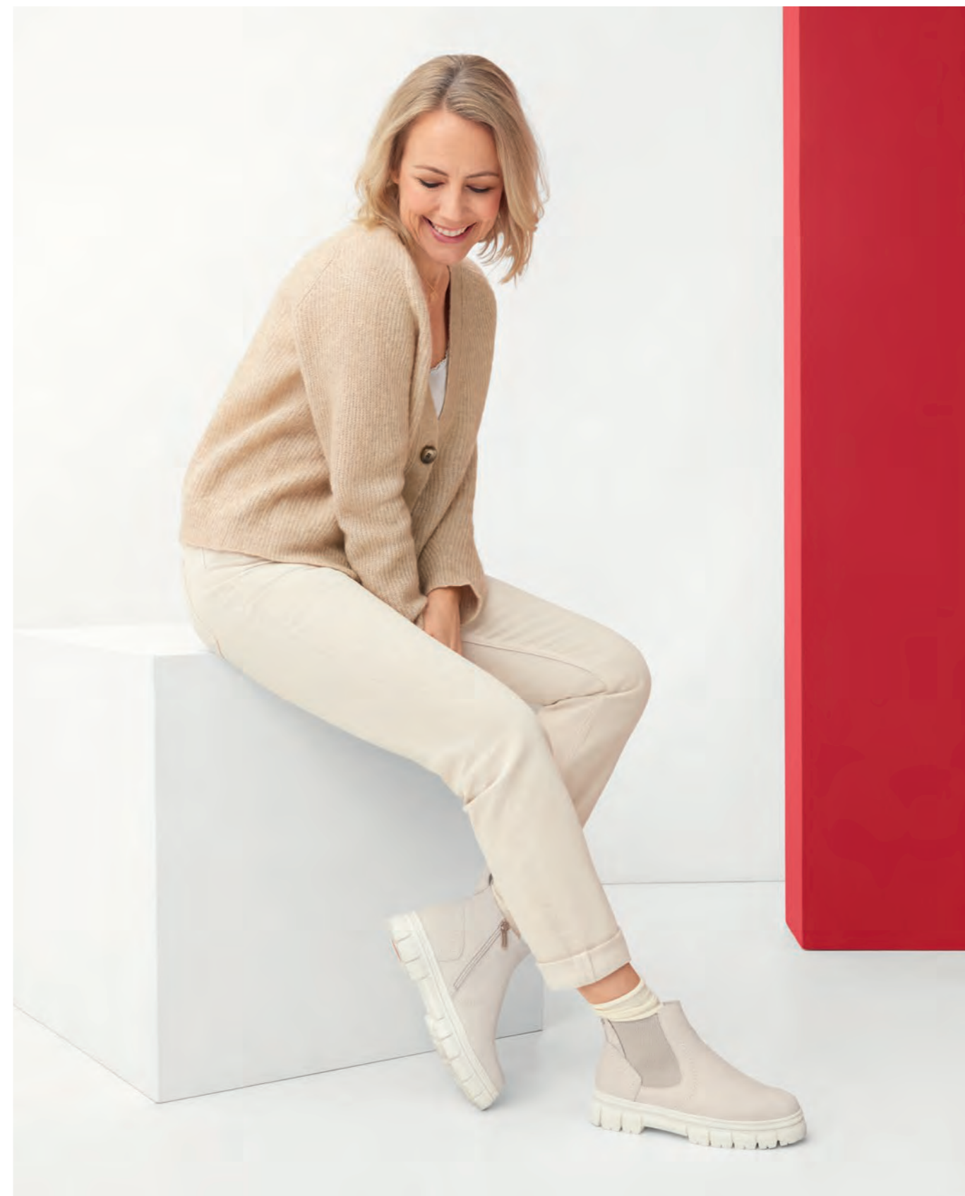
left LONG-CHELSEA BOOT 85401-29 341 | right CHELSEA BOOT 85400-29 413