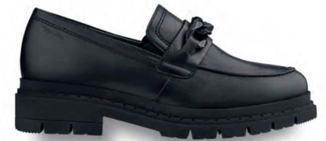
LOAFER 84703-29 001