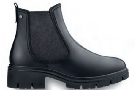
CHELSEA BOOT 85403-29 022

A good pair of shoes should provide sufficient freedom of movement and deliver relaxation and relief for feet in everyday life. In addition, elastic stretch inserts on the shaft provide individual width adjustment and sufficient hold for every woman.