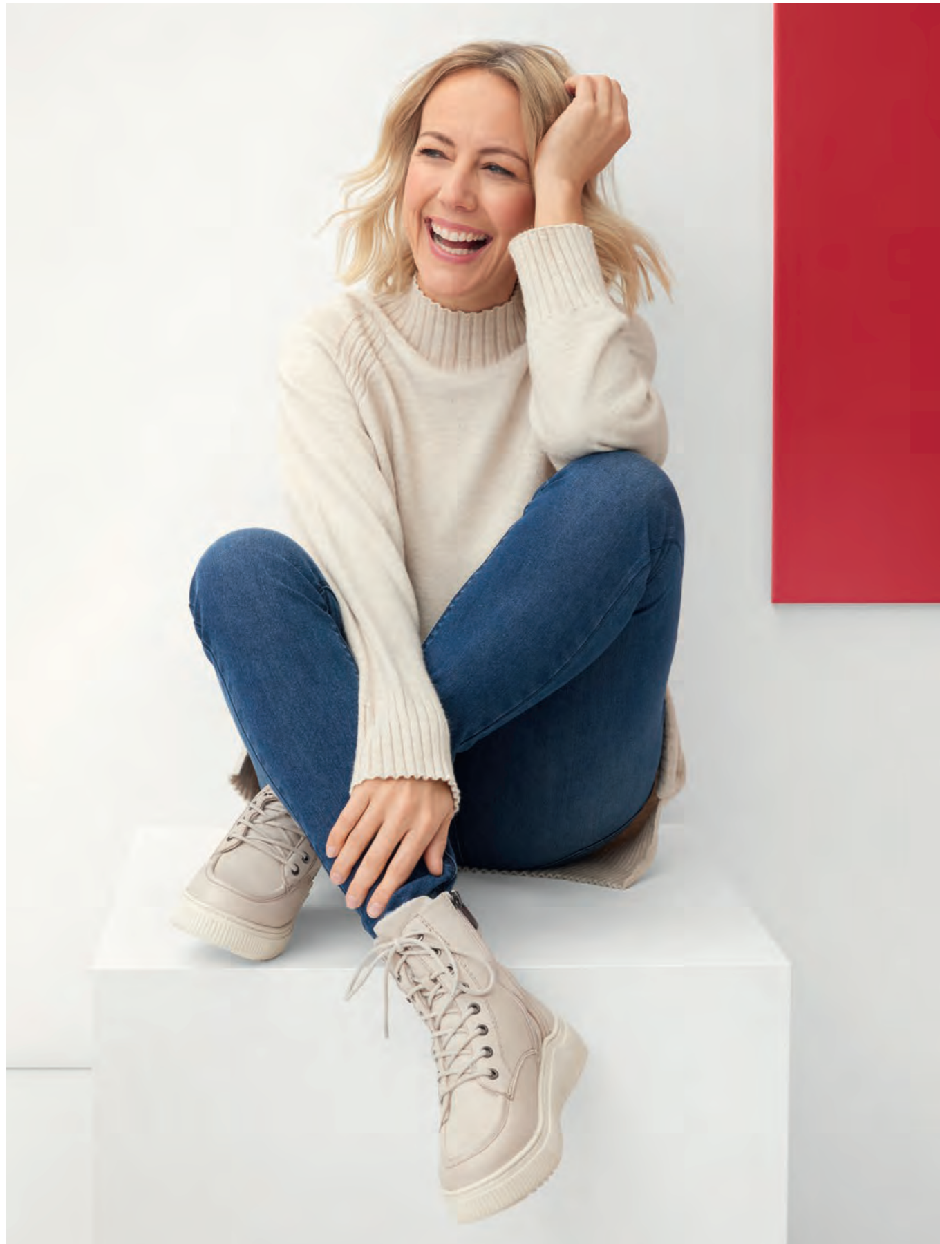
cover LACE-UP BOOT 85201-29 341 | LACE-UP BOOT 86220-29 413