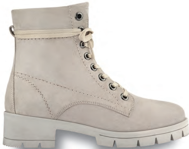
left LACE-UP BOOT 85212-29 204 | right CHELSEA BOOT 85412-29 348