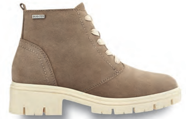
LACE-UP BOOT 85206-29 341