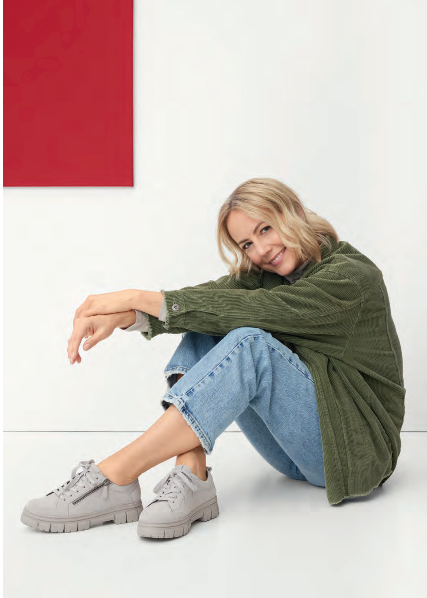
LACE-UP 83703-29 200