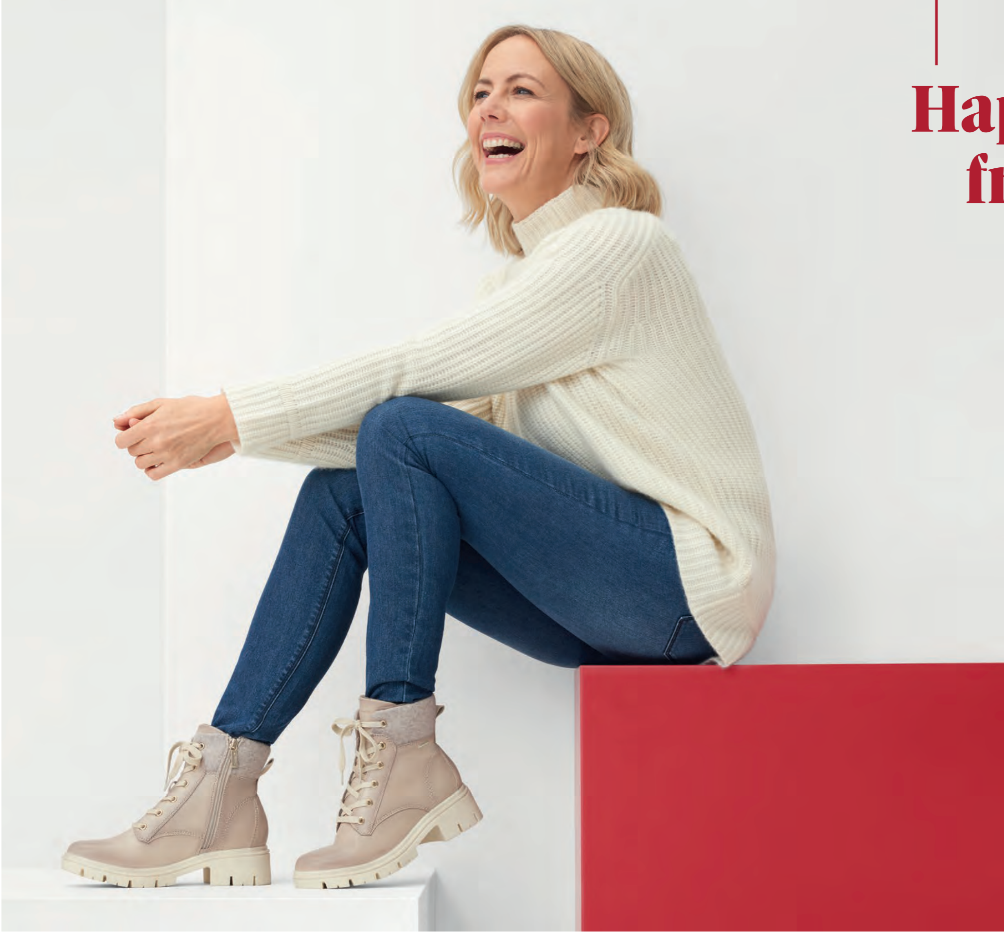
LACE-UP BOOT 86213-29 411