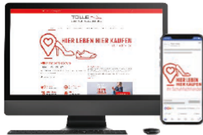
Website Banner & Social Media