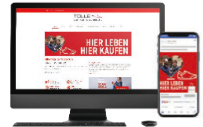
Website Banner & Social Media