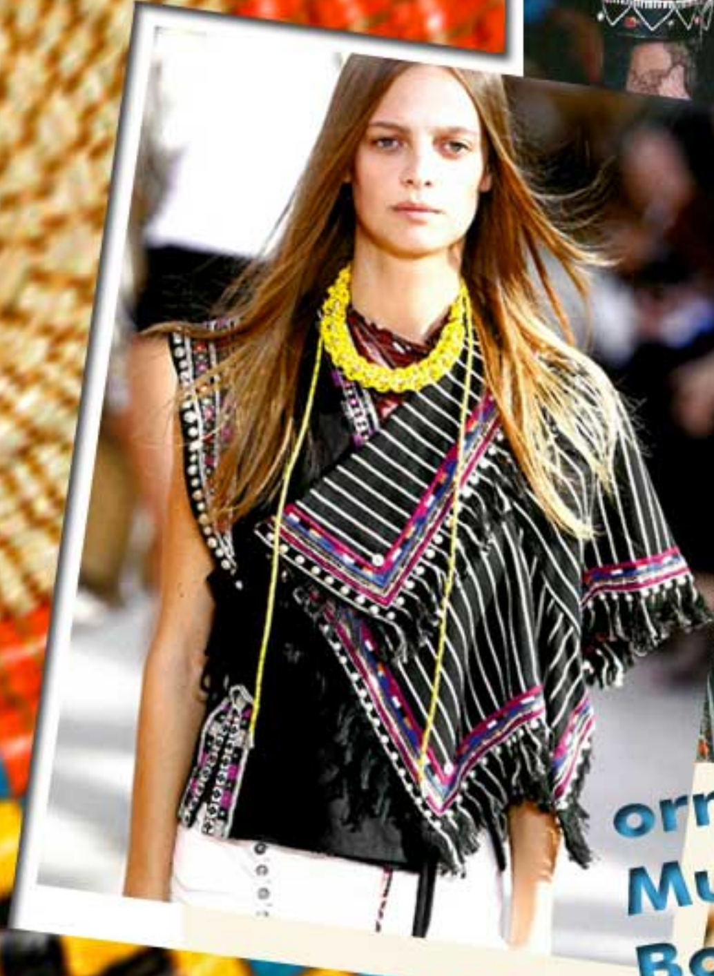
ornamentale Muster und Bordüren