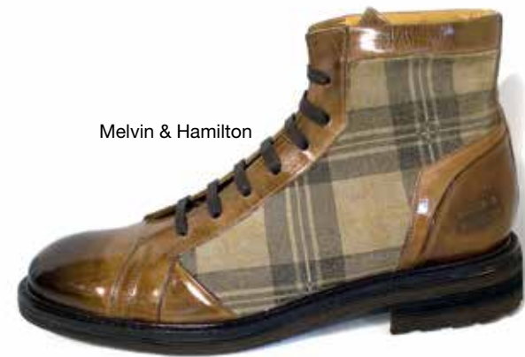
Melvin & Hamilton