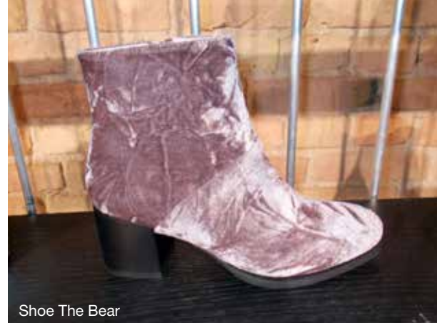
Shoe The Bear