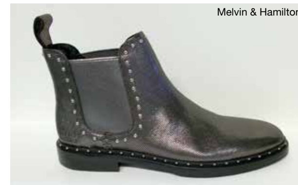
Melvin & Hamilton