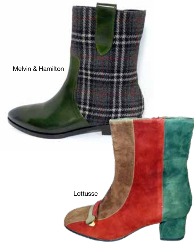
Melvin & Hamilton