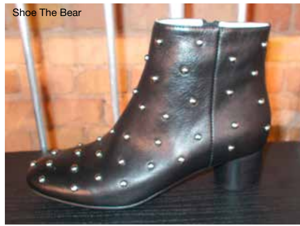
Shoe The Bear