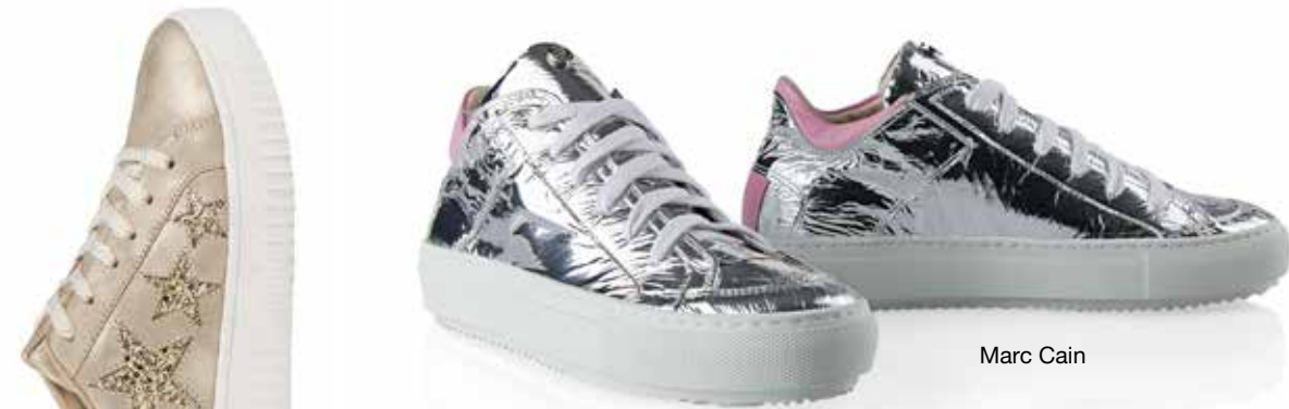
Fritzi aus Preußen