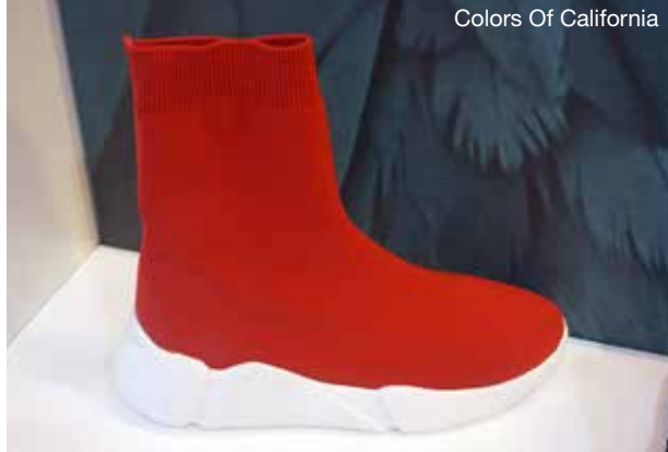
Colors Of California