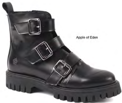
Apple of Eden