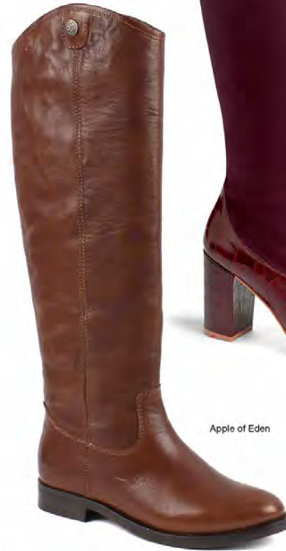
Apple of Eden