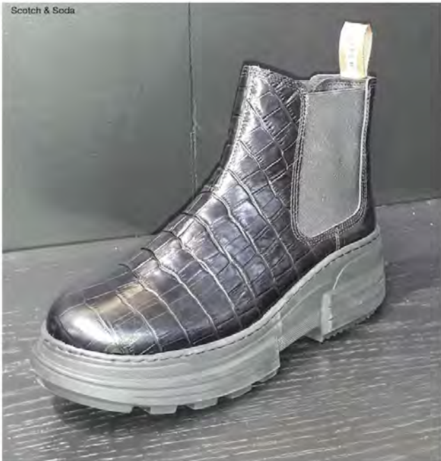
Scotch & Soda