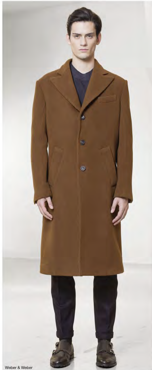
Weber & Weber