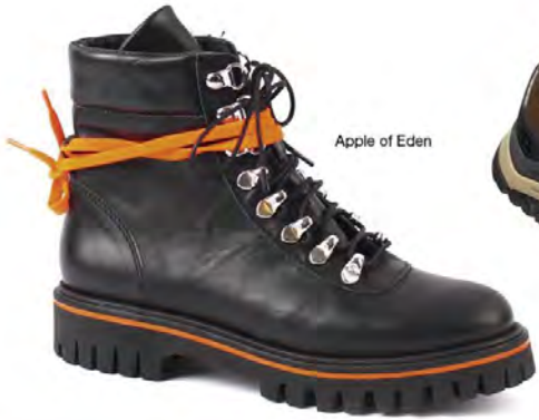
Apple of Eden