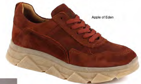
Apple of Eden