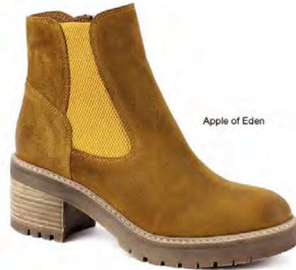
Apple of Eden