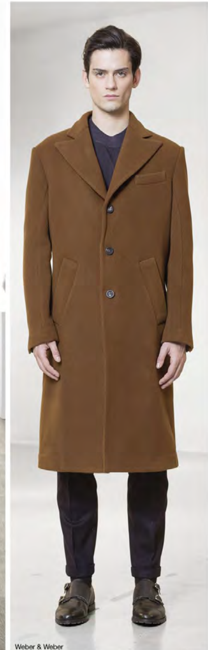
Weber & Weber