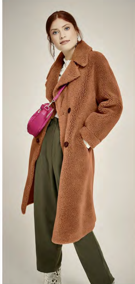
FELL & PLÜSCH