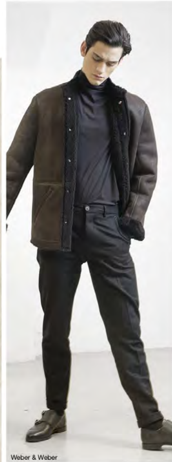
Weber & Weber