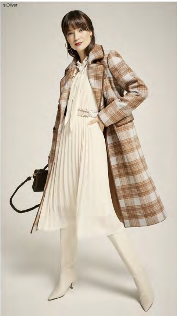
DRESSES & SKIRTS