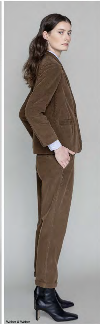
Weber & Weber