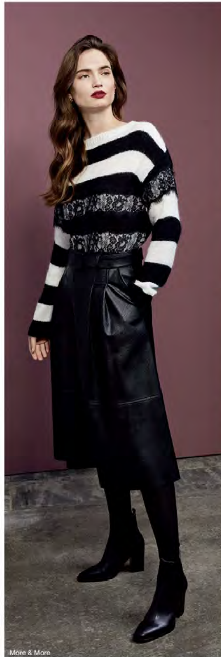
More & More