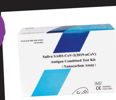
Corona-Schnelltests Paket mit 20 Stück