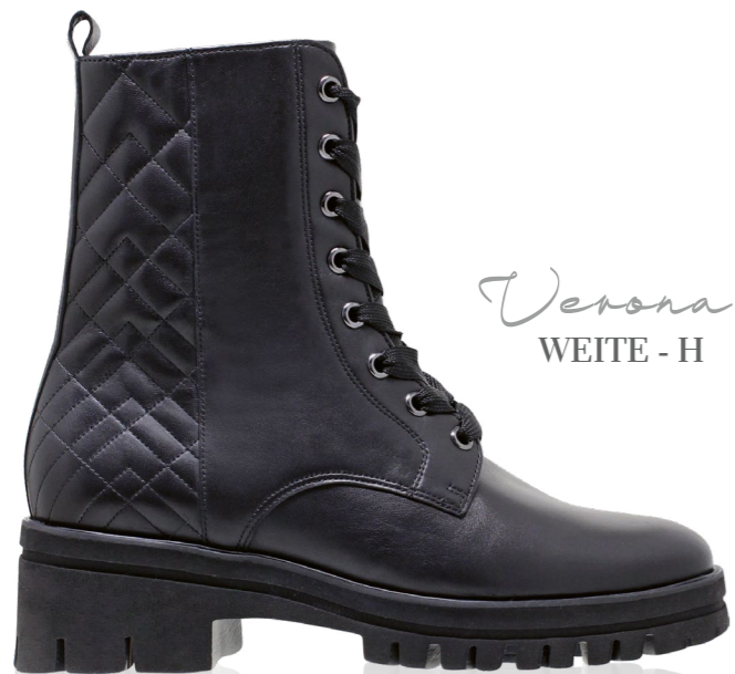
Verona WEITE - H