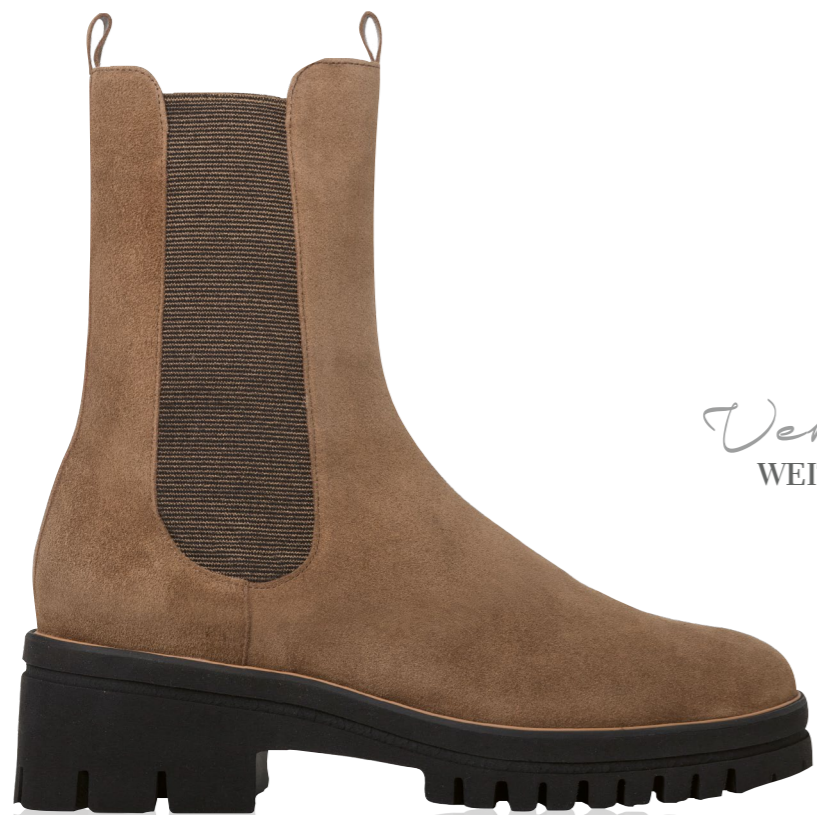
Verona WEITE - H