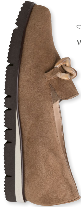
Pisa WEITE - G