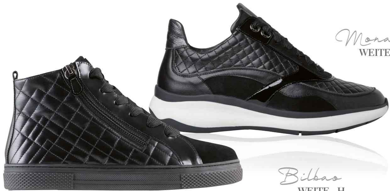
Monaco WEITE - H