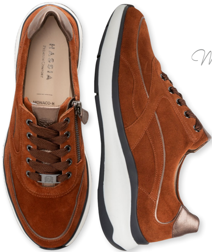
Monaco WEITE - H