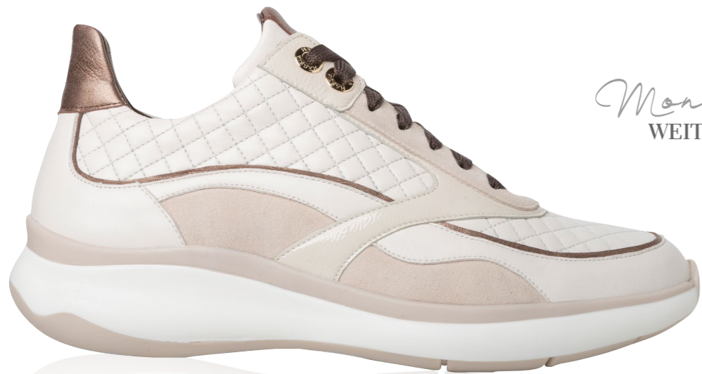
Monaco WEITE - H