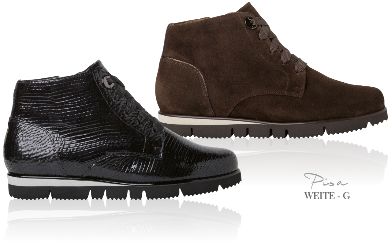
Pisa WEITE - G