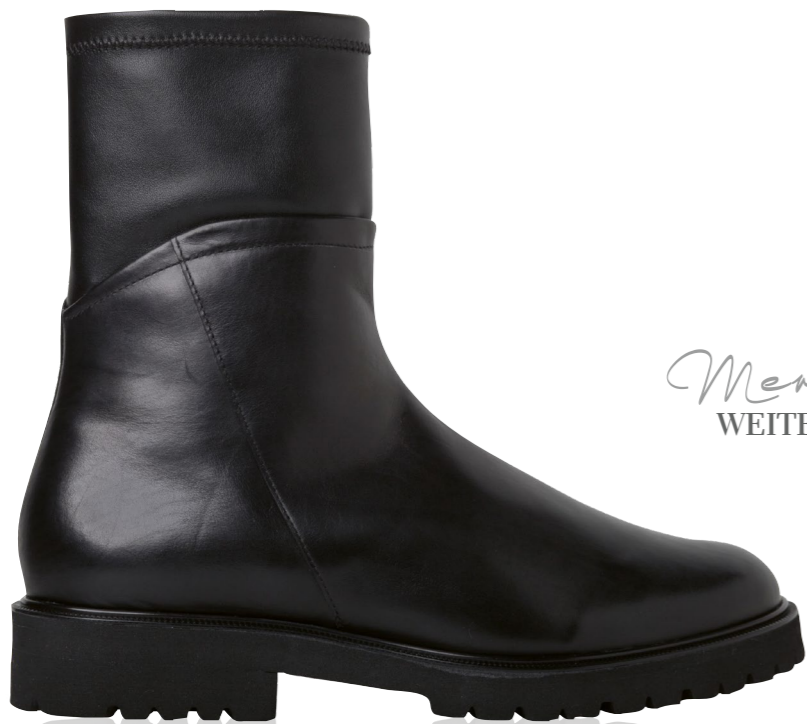
Meran WEITE - H