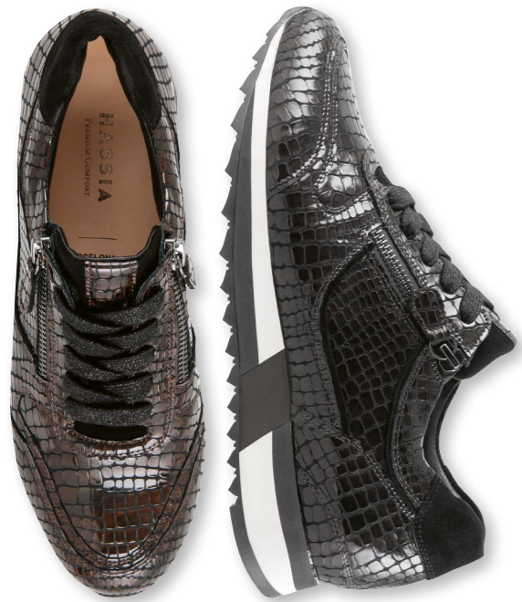
Madrid WEITE - K