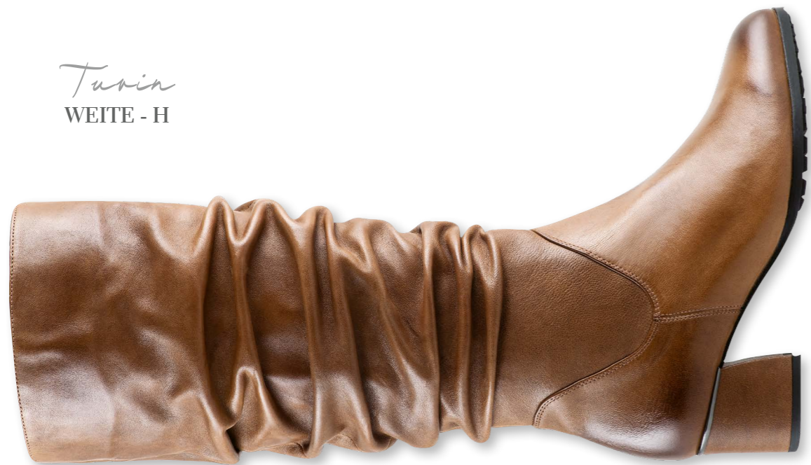
Turin WEITE - H