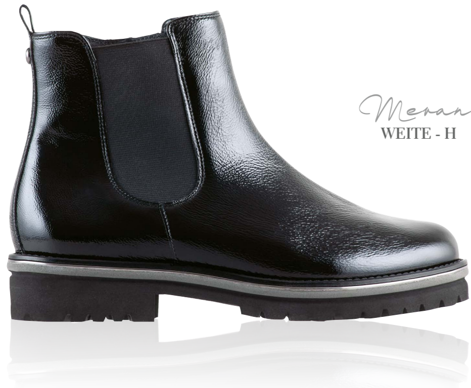
Meran WEITE - H