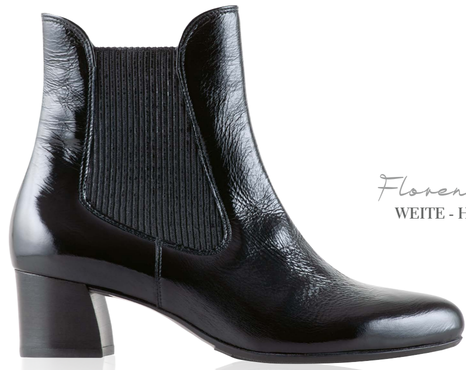
Florenz WEITE - H