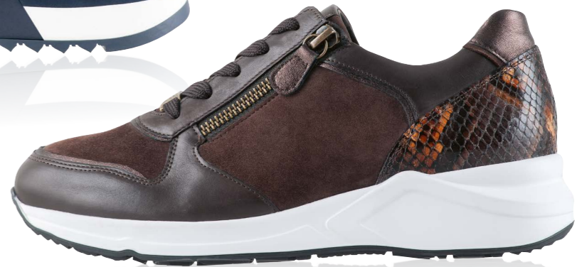
Valencia WEITE - H