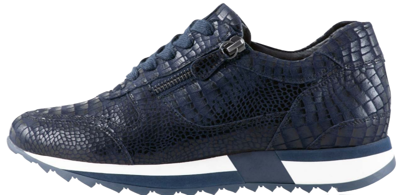
Madrid WEITE - K