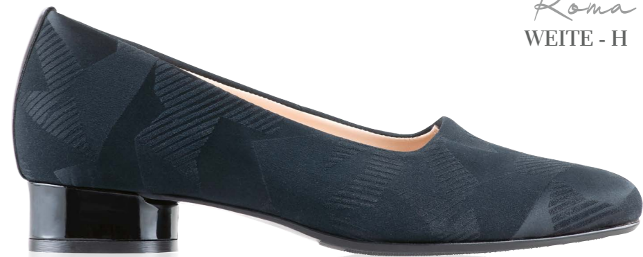
Roma WEITE - H