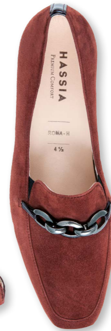
Roma WEITE - H