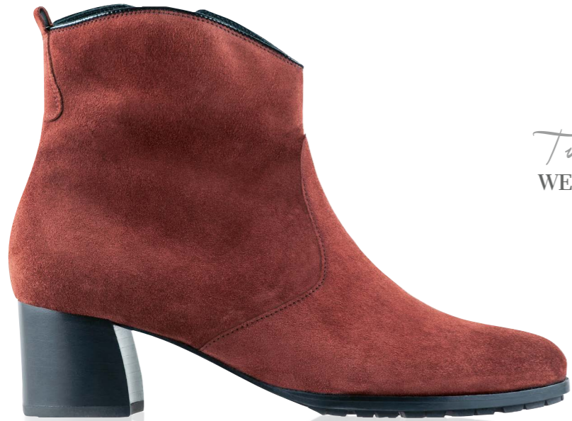
Turin WEITE - H