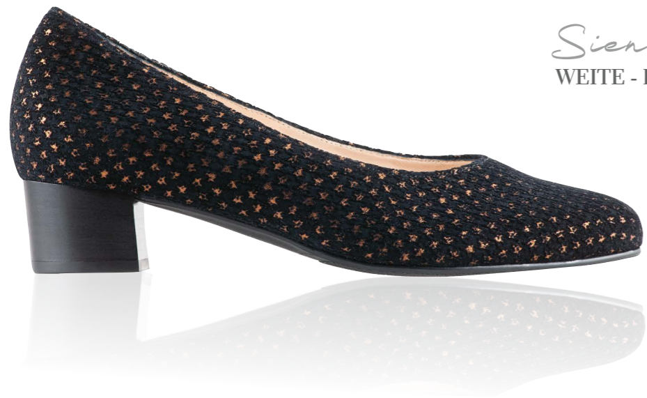
Siena WEITE - H