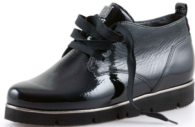
Pisa WEITE - G