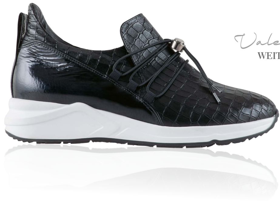
Valencia WEITE - H