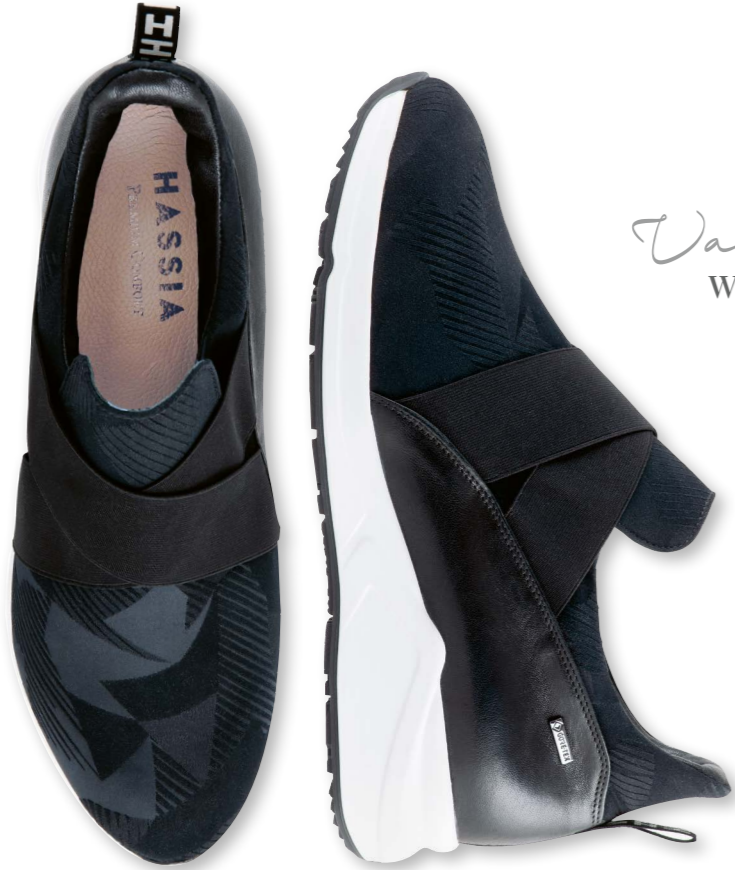
Valencia WEITE - H