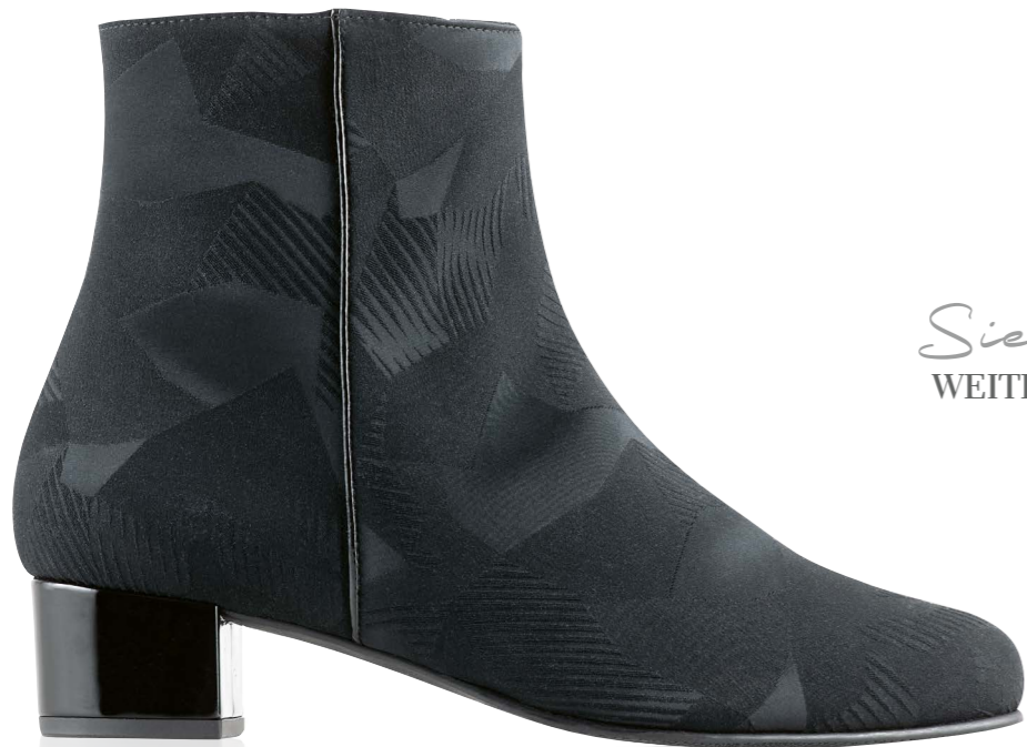
Siena WEITE - H