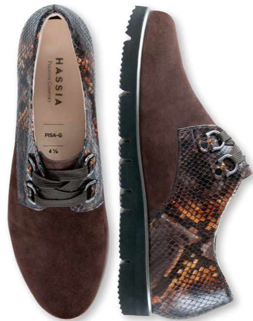
Pisa WEITE - G