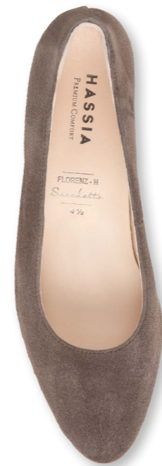
Florenz WEITE - H