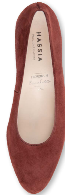
Florenz WEITE - H