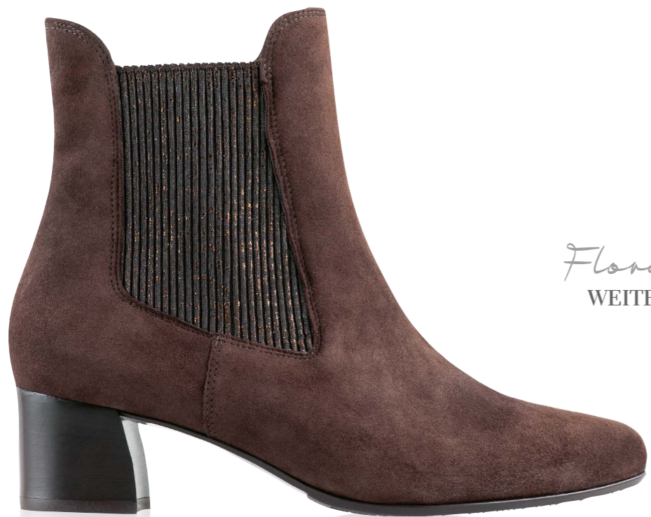
Florenz WEITE - H