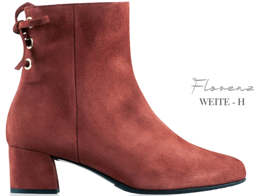
Florenz WEITE - H