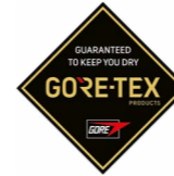
Monaco WEITE - H