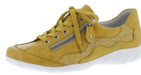
R3416-68 LM V gelb/sonne Odeon/Montreux G lose Einlage 36-45 003410 / 79.95 EUR