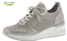
D3208-60 - V perle/perle-gold Odense/Knitup123 G lose Einlage SoftFoam 35-42 003085 / 74.95 EUR