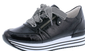
D1302-02 LSP V nero/black LaosPat/Lagro G weiche lose Einlage 36-45 003410 / 79.95 EUR