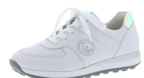
R1800-81 MDR V weiss/weiss/silber-multi Rock/Mesh18/Mirror G lose Einlage SoftFoam 36-42 003085 / 74.95 EUR