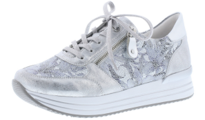
D1300-90 LSP V ice/blau-weiss/argento Space/Flores/Mirror G weiche lose Einlage 36-45 003410 / 79.95 EUR