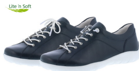
R3515-14 MDR v pazifik Odeon G lose Einlage SoftFoam 36-45 002885 / 69.95 EUR