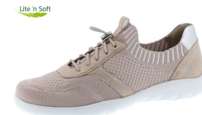
R3511-31 - V hellrosa/rosegold/silver Knitup50/Nanao/Pamplona G lose Einlage SoftFoam 36-45 002885 / 69.95 EUR