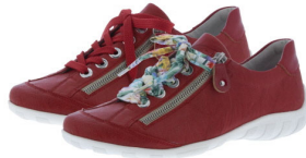
R3435-33 LM V flamme/flamme Ottawa/Lagro G lose Einlage 36-45 003085 / 74.95 EUR