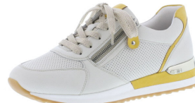
R2524-81 MDR V offwhite/gelb Rock/Odense F 1/2 lose Einlage SoftFoam 36-45 003410 / 79.95 EUR