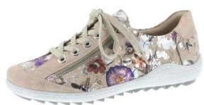
R1402-32 M v rosegold/nude-metallic Nanao/Madeira G lose Einlage SoftFoam 36-45 003410 / 79.95 EUR