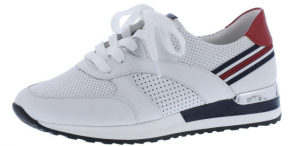
R2525-80 MDR V weiss/silver/flamme/weiss/r Rock/Pamplona/Lagro/Alabama F 1/2 lose Einlage SoftFoam 36-45 003410 / 79.95 EUR