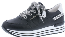
D1312-01 LSP v nero/ice Rock/Guamo G weiche lose Einlage 36-45 003410 / 79.95 EUR