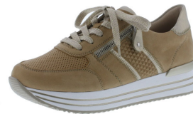
D1310-60 LSP V sand/muschel Columbo/Alula G weiche lose Einlage 36-45 003410 / 79.95 EUR