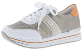
D1309-90 LSP V weiss/altsilber/weiss/musch Rock/Rhodos/Genua/Alula/Ode G weiche lose Einlage 36-45 003410 / 79.95 EUR