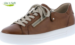
D0903-24 MDR V muskat/cayenne Odeon/Eagle G lose Einlage SoftFoam 36-45 003410 / 79.95 EUR