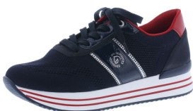
D1314-14 - V pazifik/pazifik/silver/marine/ Knitup124/Namur/Pamplona/La G weiche lose Einlage 36-45 003085 / 74.95 EUR