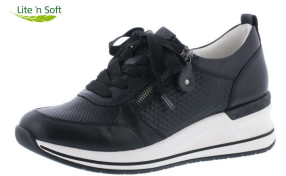
D3207-01 MDR V schwarz/schwarz/graphit Odeon/Fino/Olymp G lose Einlage SoftFoam 35-42 003410 / 79.95 EUR