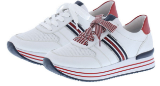
D1305-80 LSP V weiss/argento/marine/flamr Rock/Mirror/Lagro/Lagro/Alabar G weiche lose Einlage 36-45 003085 / 74.95 EUR