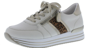
D1310-80 LSP V offwhite/muschel/leo-nuss Rock/Alula/Microstretch G weiche lose Einlage 36-45 003410 / 79.95 EUR