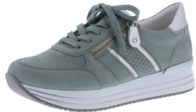
D1310-52 LSP V mint/silver Columbo/Pamplona G weiche lose Einlage 36-45 003410 / 79.95 EUR