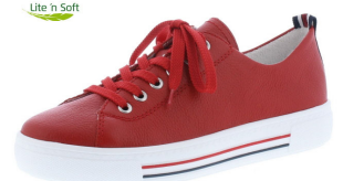
D0900-33 TF V scala Harar G lose Einlage SoftFoam 36-45 002885 / 69.95 EUR