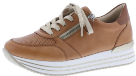
D1311-22 LSP V noccia/cayenne Odeon/Eagle G weiche lose Einlage 36-45 003410 / 79.95 EUR