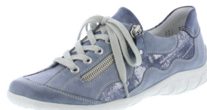
R3416-14 LM V jeans/jeans/silber Ravenna/Serbia/Postcardprint G lose Einlage 36-45 003410 / 79.95 EUR