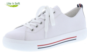
D0900-80 TF V weiss Harar G lose Einlage SoftFoam 36-45 002885 / 69.95 EUR