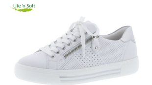
D0911-80 MDR V weiss/silver Rock/Pamplona G lose Einlage SoftFoam 36-45 003085 / 74.95 EUR