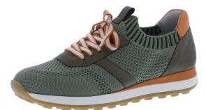
D1813-54 - V olive/olive/orange Knitup50/Eastbourne/Odense G lose Einlage SoftFoam 36-42 002885 / 69.95 EUR