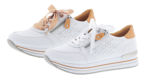
D1313-80 LSP V weiss/orange Rock/Odense G weiche lose Einlage 36-45 003410 / 79.95 EUR