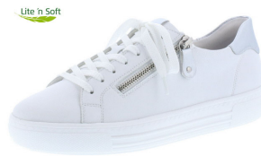
D0903-80 MDR V weiss/silver Rock/Pamplona G lose Einlage SoftFoam 36-45 003410 / 79.95 EUR