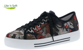
D0912-02 MTF V schwarz-multi/black Aloha/Lagro G lose Einlage SoftFoam 36-45 002670 / 64.95 EUR