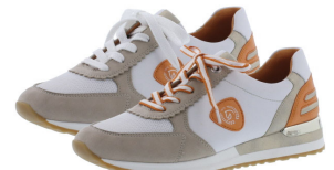
R2527-61 MDR V cliff/weiss/weiss/orange/mu Columbo/Mesh18/Rock/Odense F 1/2 lose Einlage SoftFoam 36-45 003410 / 79.95 EUR