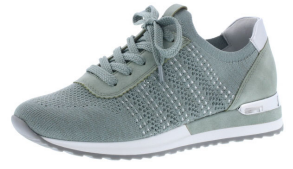
R2507-52 - V mint/peppermint/silver Knitup67/Morelia/Pamplona F 1/2 lose Einlage SoftFoam 36-45 003085 / 74.95 EUR