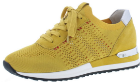
R2507-68 - V sonne/sonne/silver Knitup67/Montreux/Pamplona F 1/2 lose Einlage SoftFoam 36-45 003085 / 74.95 EUR