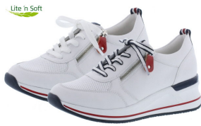
D3207-80 MDR V weiss/marine/flamme Rock/Lagro/Lagro G lose Einlage SoftFoam 35-42 003410 / 79.95 EUR