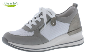
D3207-40 MDR V cloud/weiss/weiss/perle Columbo/Rock/Alabama/Odens G lose Einlage SoftFoam 35-42 003410 / 79.95 EUR