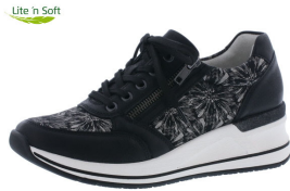
D3203-04 - v schwarz/schwarz/pearlcrea Eagle/Scuba/Fleurprint G lose Einlage SoftFoam 35-42 003085 / 74.95 EUR