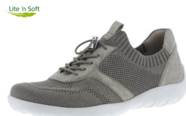
R3511-64 - V fango-spark/perle Knitup50/Odense G lose Einlage SoftFoam 36-45 002885 / 69.95 EUR