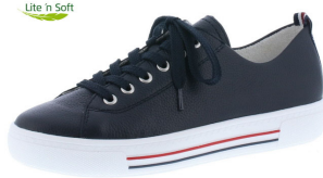
D0900-15 TF V pazifik Harar G lose Einlage SoftFoam 36-45 002885 / 69.95 EUR