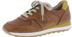
R1800-22 MDR V noccia/sonne/cayenne Odeon/Montreux/Eagle G lose Einlage SoftFoam 36-42 003085 / 74.95 EUR