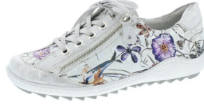
R1402-90 M V ice/offwhite-metallic Space/Madeira G lose Einlage SoftFoam 36-45 003410 / 79.95 EUR