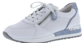
R2524-80 MDR V weiss/bleu Rock/Odense F 1/2 lose Einlage SoftFoam 36-45 003410 / 79.95 EUR