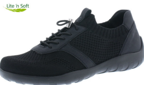
R3511-01 - v schwarz/schwarz Knitup50/Namur G lose Einlage SoftFoam 36-45 002885 / 69.95 EUR