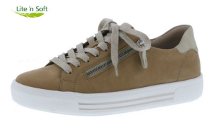
D0903-60 MDR V sand/muschel Columbo/Alula G lose Einlage SoftFoam 36-45 003410 / 79.95 EUR