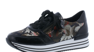
D1302-03 LSP V black/schwarz-multi Lagro/Aloha G weiche lose Einlage 36-45 002885 / 69.95 EUR