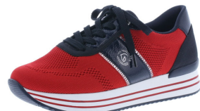
D1314-33 - v flamme/pazifik/silver/marine Knitup124/Namur/Pamplona/La G weiche lose Einlage 36-45 003085 / 74.95 EUR