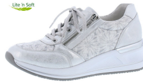
D3203-90 - V ice/reinweiss/silber Guamo/Scuba/Fleurprint G lose Einlage SoftFoam 35-42 003085 / 74.95 EUR