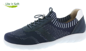
R3511-14 - V pazifik/pazifik/silver Knitup50/Namur/Pamplona G lose Einlage SoftFoam 36-45 002885 / 69.95 EUR