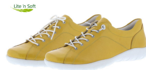
R3515-68 MDR V gelb Odeon G lose Einlage SoftFoam 36-45 002885 / 69.95 EUR