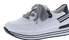
D1312-80 LSP V weiss/black Rock/Lagro G weiche lose Einlage 36-45 003410 / 79.95 EUR