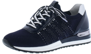
R2507-14 - V pazifik/marine/silver Knitup67/Lagro/Pamplona F 1/2 lose Einlage SoftFoam 36-45 003085 / 74.95 EUR