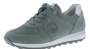
R1800-52 MDR V mint/mint/silver Columbo/Mesh18/Pamplona G lose Einlage SoftFoam 36-42 003085 / 74.95 EUR