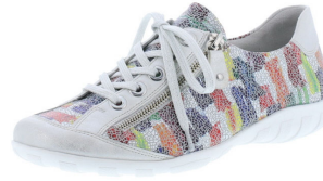
R3435-91 LM V ice/weiss-multi Odessa/Palmera G lose Einlage 36-45 003085 / 74.95 EUR