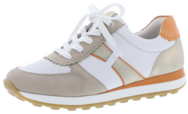
R1801-80 MDR V cliff/weiss/orange/muschel Columbo/Rock/Odense/Alula G lose Einlage SoftFoam 36-42 003085 / 74.95 EUR