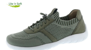
R3511-54 - V olive/olive Knitup50/Eastbourne G lose Einlage SoftFoam 36-45 002885 / 69.95 EUR