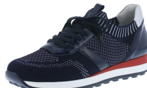
D1813-14 - V pazifik/marine/silver Knitup50/Lagro/Pamplona G lose Einlage SoftFoam 36-42 002885 / 69.95 EUR