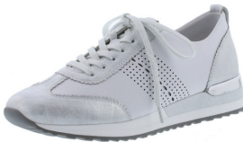
R2526-80 MDR V ice/weiss Guamo/Rock F 1/2 lose Einlage SoftFoam 36-45 003085 / 74.95 EUR