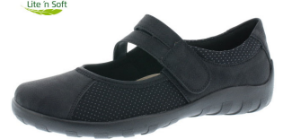
R3510-02 M V schwarz/schwarz/schwarz Namur/Scuba/Punktprint G lose Einlage SoftFoam 36-45 002670 / 64.95 EUR