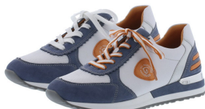
R2527-15 MDR V jeans/weiss/weiss/orange/ic Columbo/Mesh18/Rock/Odense F 1/2 lose Einlage SoftFoam 36-45 003410 / 79.95 EUR