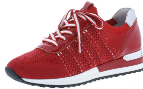
R2507-33 - V flamme/flamme/silver Knitup67/Lagro/Pamplona F 1/2 lose Einlage SoftFoam 36-45 003085 / 74.95 EUR