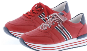
D1305-33 LSP V scala/argento/marine/rosso Rock/Mirror/Lagro/Kostau G weiche lose Einlage 36-45 003085 / 74.95 EUR