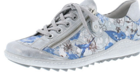
R1402-92 M v ice/offwhite-blue Space/Madeira G lose Einlage SoftFoam 36-45 003410 / 79.95 EUR