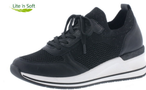
D3208-01 - v schwarz/schwarz-spark/graj Eagle/Knitup123/Olymp G lose Einlage SoftFoam 35-42 003085 / 74.95 EUR