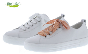
D0900-81 MTF V weiss Rock G lose Einlage SoftFoam 36-45 002885 / 69.95 EUR