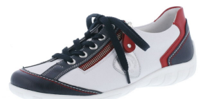
R3421-80 LSP V pazifik/weiss/scala/silver Harar/Rock/Harar/Pamplona G lose Einlage 36-45 003085 / 74.95 EUR