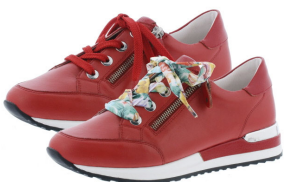
R2528-33 MDR V flamme/flamme Odeon/Lagro F 1/2 lose Einlage SoftFoam 36-45 003410 / 79.95 EUR