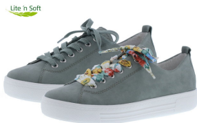
D0900-52 TF V mint Columbo G lose Einlage SoftFoam 36-45 002885 / 69.95 EUR