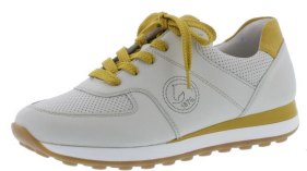
R1800-80 MDR V offwhite/sonne Rock/Montreux G lose Einlage SoftFoam 36-42 003085 / 74.95 EUR