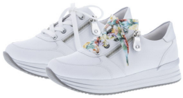
D1302-80 LSP V weiss/argento Rock/Mirror G weiche lose Einlage 36-45 003410 / 79.95 EUR