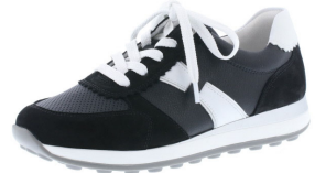
R1801-01 MDR V schwarz/nero/silver/weiss Columbo/Rock/Pamplona/Alab G lose Einlage SoftFoam 36-42 003085 / 74.95 EUR