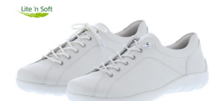
R3515-80 MDR v bianco Odeon G lose Einlage SoftFoam 36-45 002885 / 69.95 EUR