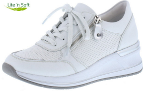
D3201-80 MDR V weiss/argento/weiss-silber Rock/Mirror/Middlesbrough G lose Einlage SoftFoam 35-42 003410 / 79.95 EUR