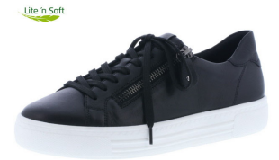
D0903-01 MDR v schwarz/schwarz Odeon/Eagle G lose Einlage SoftFoam 36-45 003410 / 79.95 EUR