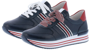
D1305-14 LSP V pazifik/argento/flamme/pazi Odeon/Mirror/Lagro/Bogota G weiche lose Einlage 36-45 003085 / 74.95 EUR