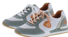
R2527-53 MDR V mint/weiss/weiss/orange/mu Columbo/Mesh18/Rock/Odense F 1/2 lose Einlage SoftFoam 36-45 003410 / 79.95 EUR