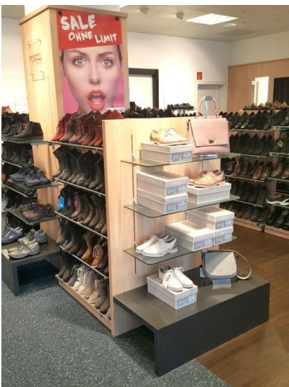
Innenraumelement mit Glasböden bzw. Spiegel