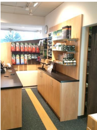
Ladentheke, Unterschrank und Wandelemente für Furnituren