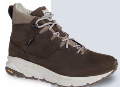
BRAIES GTX W'S BOOTS