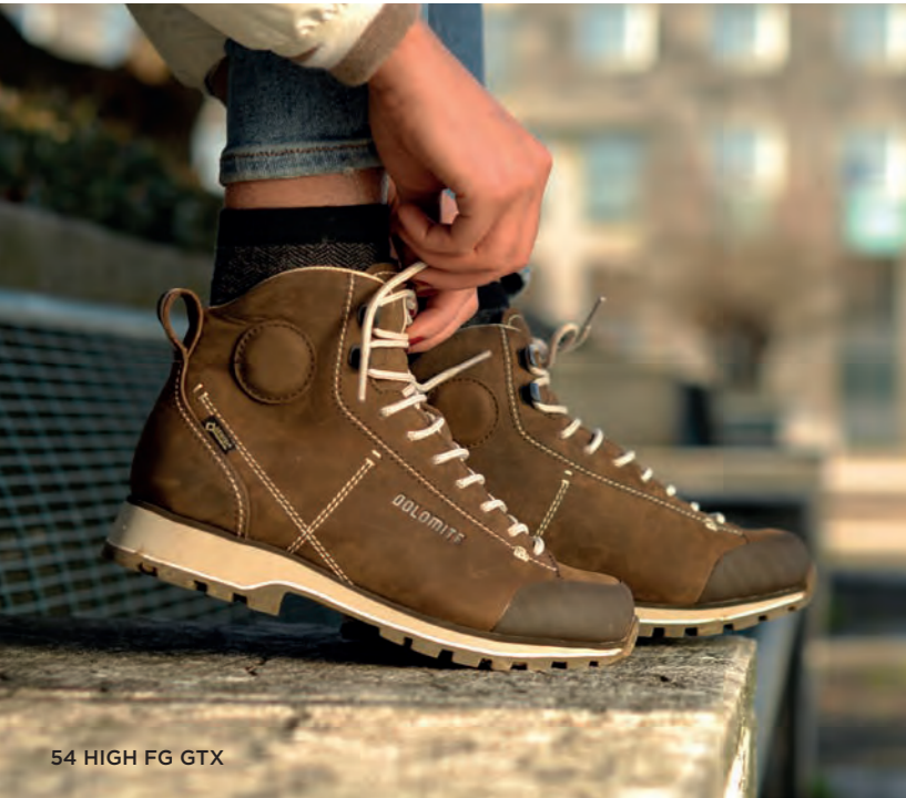
54 HIGH FG GTX

Auf der Isle of Wight zu wandern sollte sich der moderne Abenteuerer nicht entgehen lassen. Mehr als die Hälfte der Insel ist eine Landschaft von unberührter Schönheit, umgeben von Wundern der Natur und geschichtsträchtigen Städten. Und natürlich ist der Blick auf die magischen Needles allein schon die Reise wert!