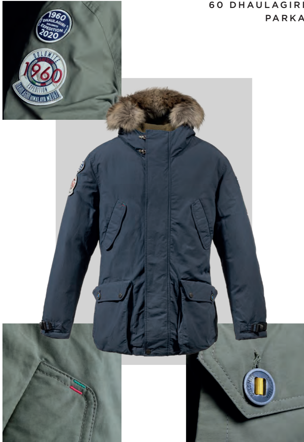
60 DHAULAGIRI PARKA