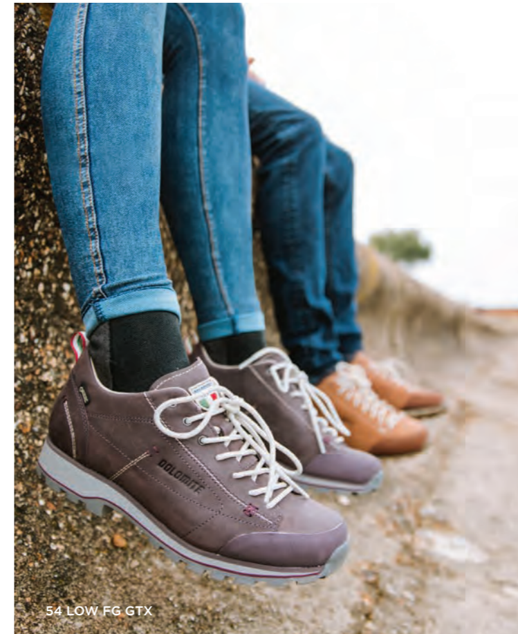
54 LOW FG GTX