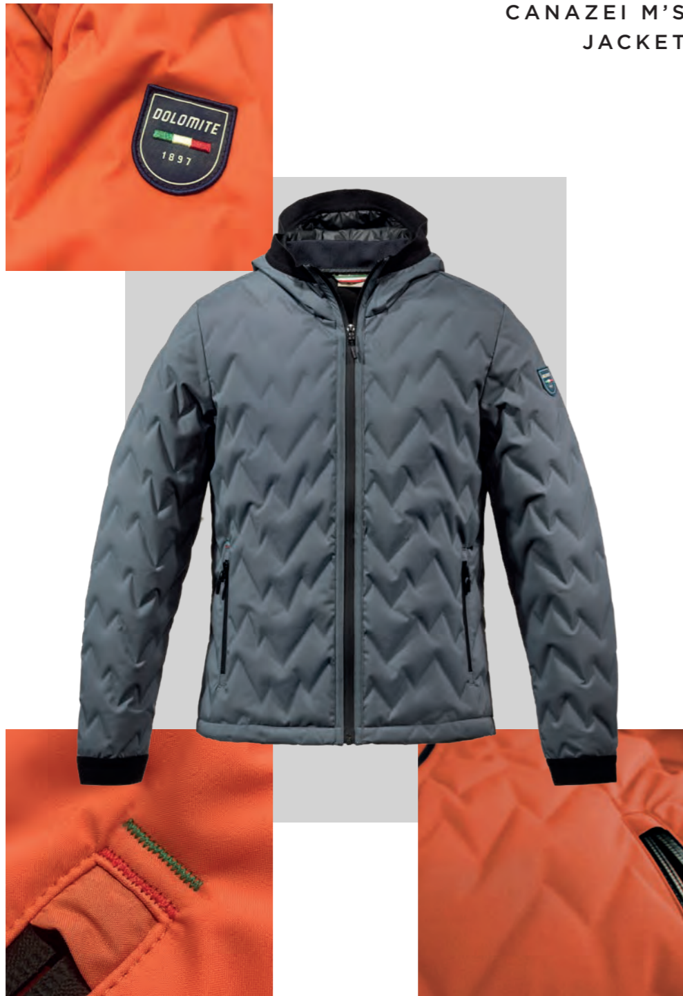
CANAZEI M'S JACKET