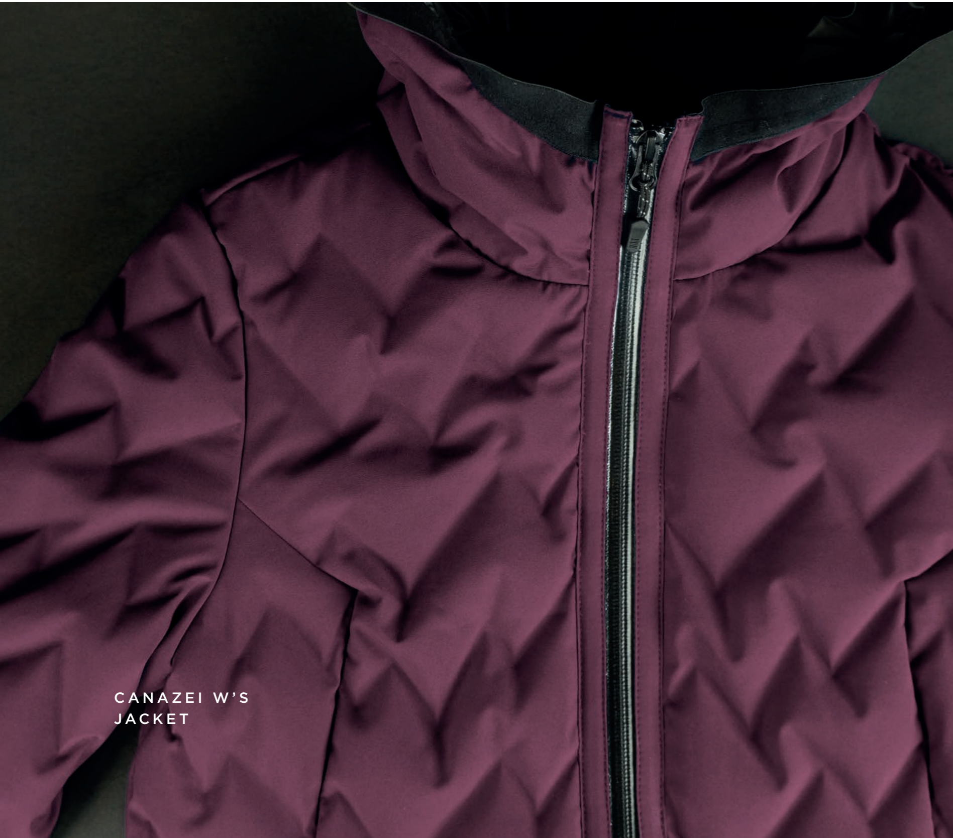
CANAZEI W'S JACKET