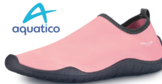
NEW! Hybrid basic rose

Art.Nr.: 859 072, Größe: 230-300 (EU 36-47) EK 9,98 €, UVP 19,95 €