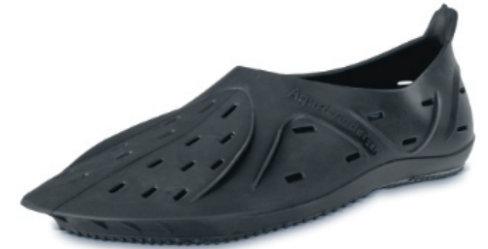
Aqualander zen black

Art.Nr.: 999, Größe: 230-290 (EU 36-46) EK 29,98 €, UVP 59,95 €