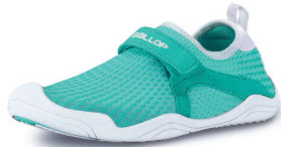
NEW Typhoon mint 2.0

Der Ballop Schuh für alle Aktivitäten rund um's Wasser