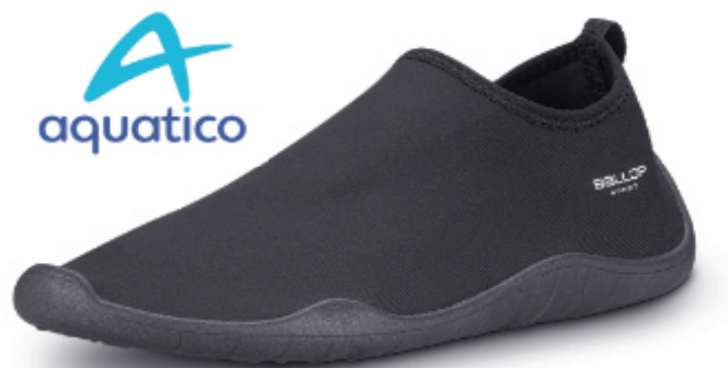
NEW! Hybrid basic black

Art.Nr.: 859 073, Größe: 230-270 (EU 36-42,5) EK 9,98 €, UVP 19,95 €