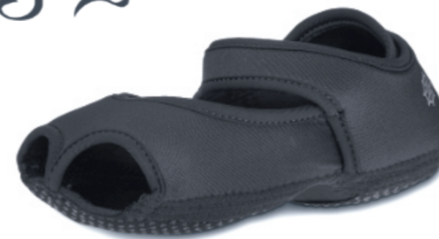
Jam Flat black

Art.Nr.: 970, Größe: S-L (EU 36-41) EK 19,98 €, UVP 39,95 €