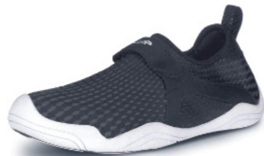
Typhoon black 2.0

Art.Nr.: 859 086, Größe: 230-270 (EU 36-42,5) EK 24,98 €, UVP 49,95 €