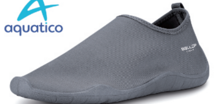
NEW! Hybrid basic grey

Art.Nr.: 859 072, Größe: 230-300 (EU 36-47) EK 9,98 €, UVP 19,95 €