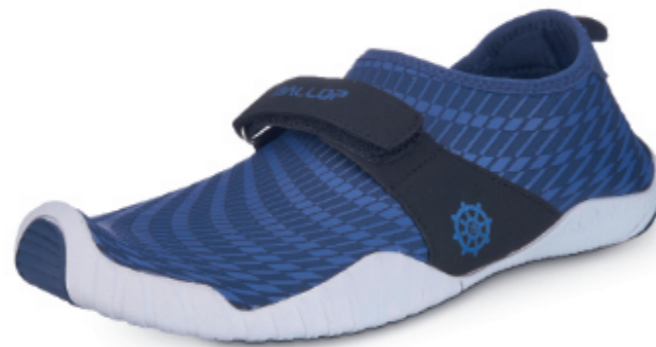
Patrol deep navy

Art.Nr.: 905, Größe: 230-300 (EU 36-47) EK 24,98 €, UVP 49,95 €