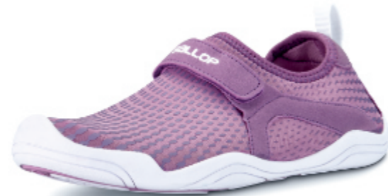
NEW Typhoon rose

Art.Nr.: 859 084, Größe: 230-270 (EU 36-42,5) EK 24,98 €, UVP 49,95 €