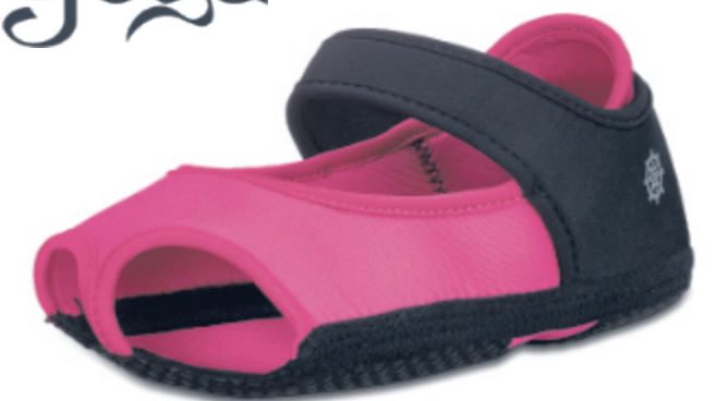
Jam Flat black-pink

Art.Nr.: 971, Größe: S-L (EU 36-41) EK 19,98 €, UVP 39,95 €