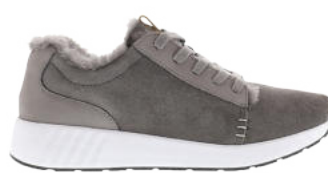
Dark Grey # 051