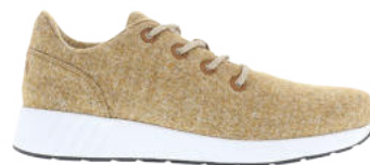
Chestnut Melange # 110 Mr. SNUG Wooly # 305