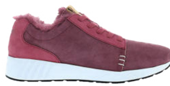
Berry # 088