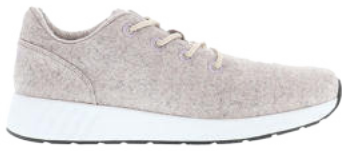
Faun Melange# 077 Ms. SNUG Wooly # 105

EUR 35 bis 43 in ganzen Größen wechselbare Ortholite Innensohle