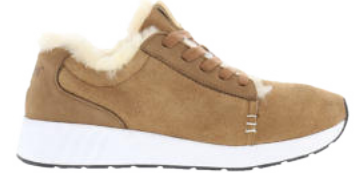
Chestnut # 110