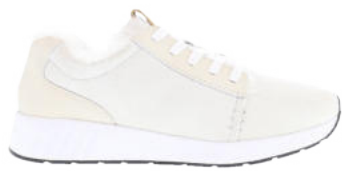
Ivory # 011