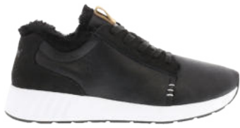
Leather Black # 210