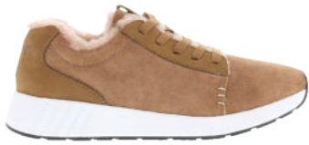
Cafe au Lait # 113