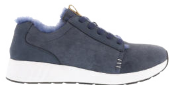
Navy # 090