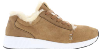
Chestnut # 110