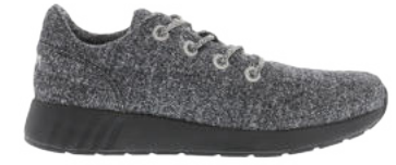
Black Melange # 010 Ms. SNUG Wooly # 115