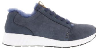
Navy # 090