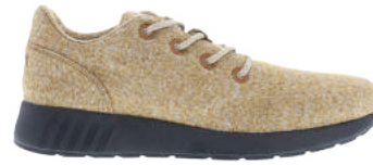
Chestnut Melange # 110 Mr. SNUG Wooly # 315