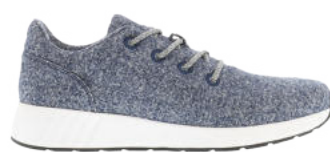
Navy Melange # 090 Mr. SNUG Wooly # 305