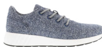
Navy Melange # 090 Ms. SNUG Wooly # 105