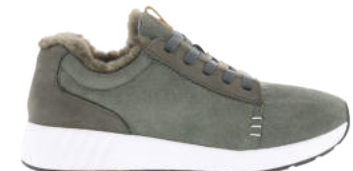
Olive # 112