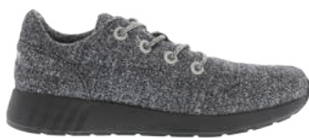
Black Melange # 010 Mr. SNUG Wooly # 315