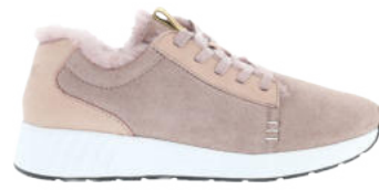
Fawn # 077