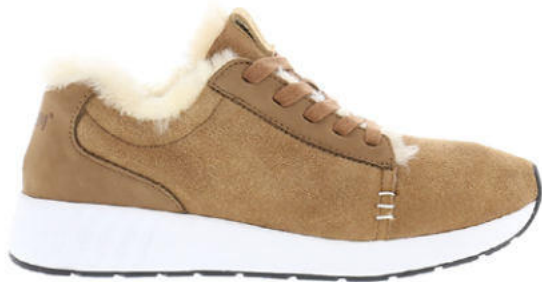
100% Merino Doubleface