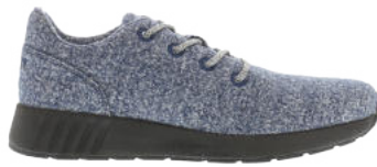
Navy Melange # 090 Mr. SNUG Wooly # 315