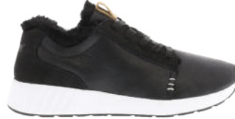
Leather Black # 210