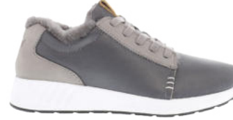
Leather Grey # 250