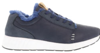
Leather Navy # 290