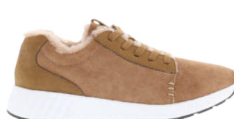
Cafe au Lait # 113