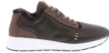
Leather Brown # 230