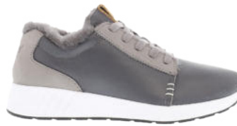
Leather Grey # 250