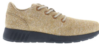
Chestnut Melange # 110 Ms. SNUG Wooly # 115