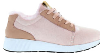
Ballett # 020