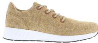
Chestnut Melange # 110 Ms. SNUG Wooly # 105