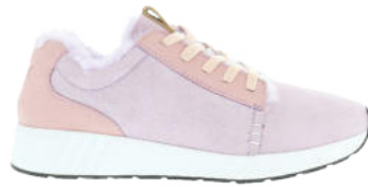
Lavender Fog # 070