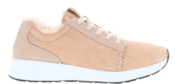
Dusty Coral # 060