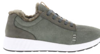
Olive # 112