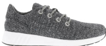
Black Melange # 010 Mr. SNUG Wooly # 305

EUR 40 bis 46 in ganzen Größen wechselbare Ortholite Innensohle