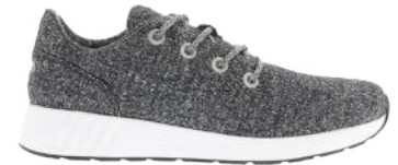
Black Melange # 010 Ms. SNUG Wooly # 105