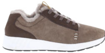
Hazelnut # 111