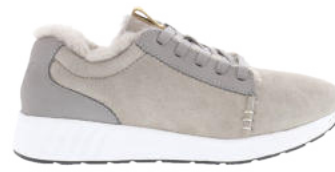
Grey # 050