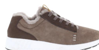
Hazelnut # 111