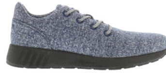
Navy Melange # 090 Ms. SNUG Wooly # 115