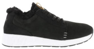
Black # 010