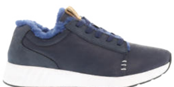
Leather Navy # 290