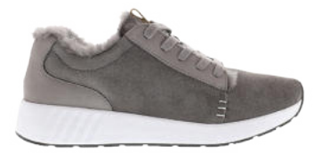
Dark Grey # 051