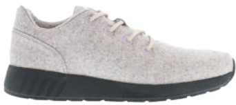
Faun Melange# 077 Ms. SNUG Wooly # 115