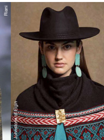
Johnstons of Elgin