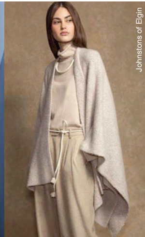
Johnstons of Elgin