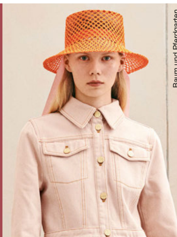
Baum und Pferdgarten