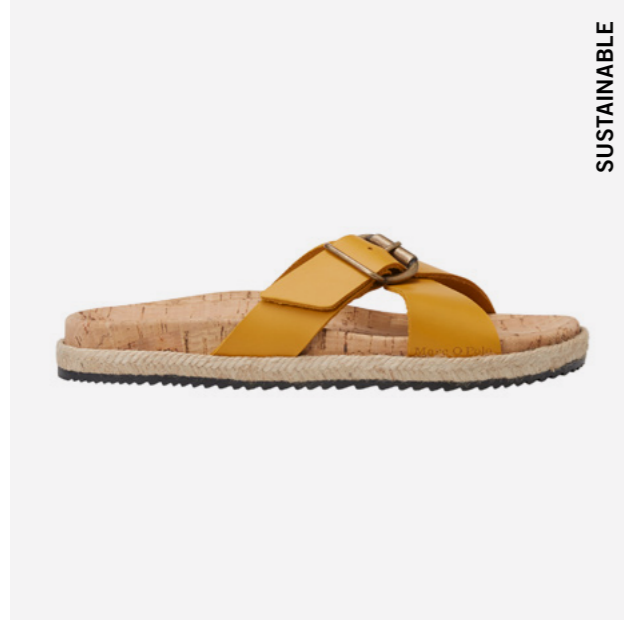
MARA 1A FLAT SANDAL 104 16501101 107 / 265 corn Sizes 36–42 RRP 89,95 €