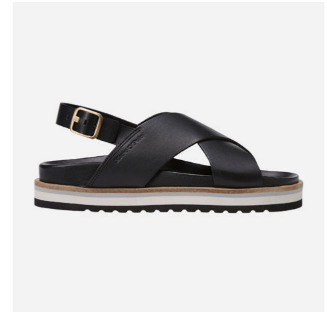
ANDREA 1A FLAT SANDAL 104 15761101 100 / 990 black Sizes 36–42 RRP 99,95 €