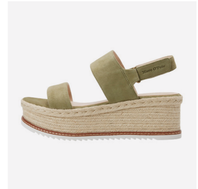
TROPEZ 2B ESPADRILLES 104 15631401 305 / 410 khaki Sizes 36–42 RRP 99,95 €