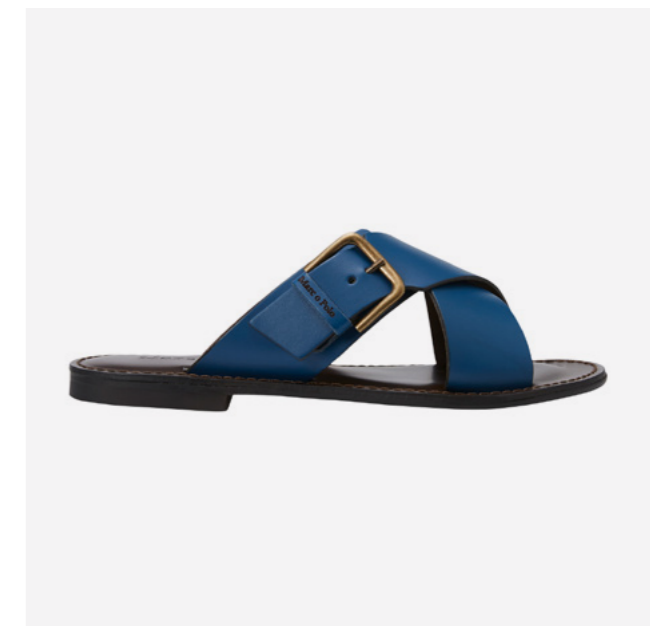
DALIA 2A FLAT SANDAL 104 16441102 107 / 850 blue Sizes 36–42 RRP 99,95 €