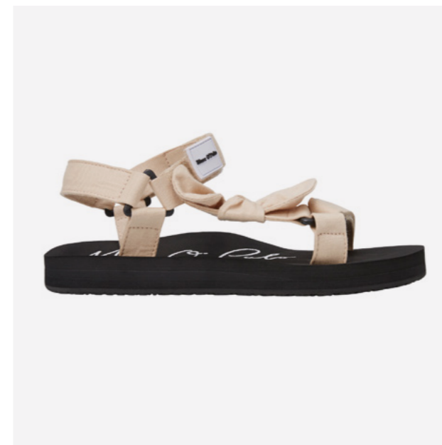
MONICA 1D BEACH SANDAL 104 16401001 612 / 715 sand Sizes 36–42 RRP 49,95 €