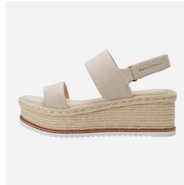
TROPEZ 2B ESPADRILLES 104 15631401 305 / 715 sand Sizes 36–42 RRP 99,95 €