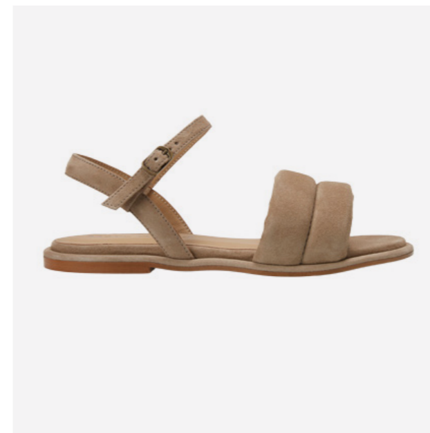
SABRINA 1B FLAT SANDAL 104 16381102 305 / 715 sand Sizes 36–42 RRP 119,95 €