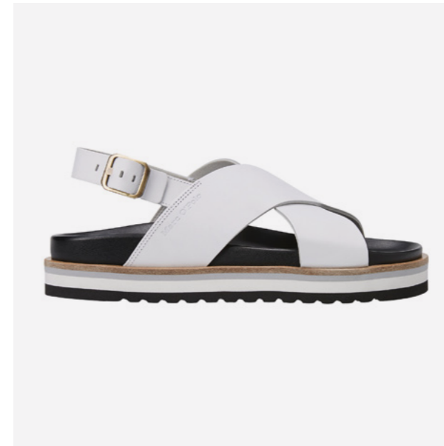
ANDREA 1A FLAT SANDAL 104 15761101 100 / 100 white Sizes 36–42 RRP 99,95 €