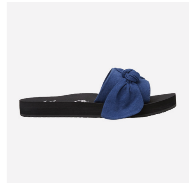
MONICA 3D BEACH SANDAL 104 16401003 612 / 850 blue Sizes 36–42 RRP 49,95 €