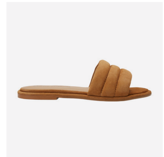
SABRINA 2B FLAT SANDAL 104 16381104 305 / 720 cognac Sizes 36–42 RRP 119,95 €