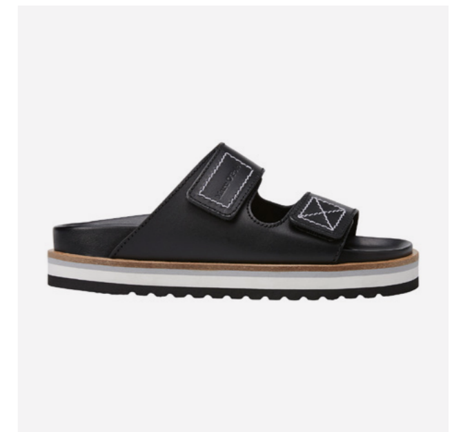
ANDREA 3A FLAT SANDAL 104 15761104 100 / 990 black Sizes 36–42 RRP 99,95 €