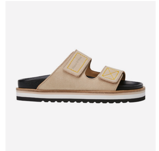
ANDREA 3B FLAT SANDAL 104 15761105 300 / 715 sand Sizes 36–42 RRP 99,95 €