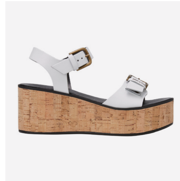
CLAUDIA 1A WEDGE SANDAL 104 16431401 107 / 100 white Sizes 36–42 RRP 119,95 €