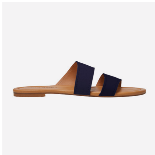
GIORGINA 2B FLAT SANDAL 104 16481104 305 / 890 navy Sizes 36–42 RRP 59,95 €