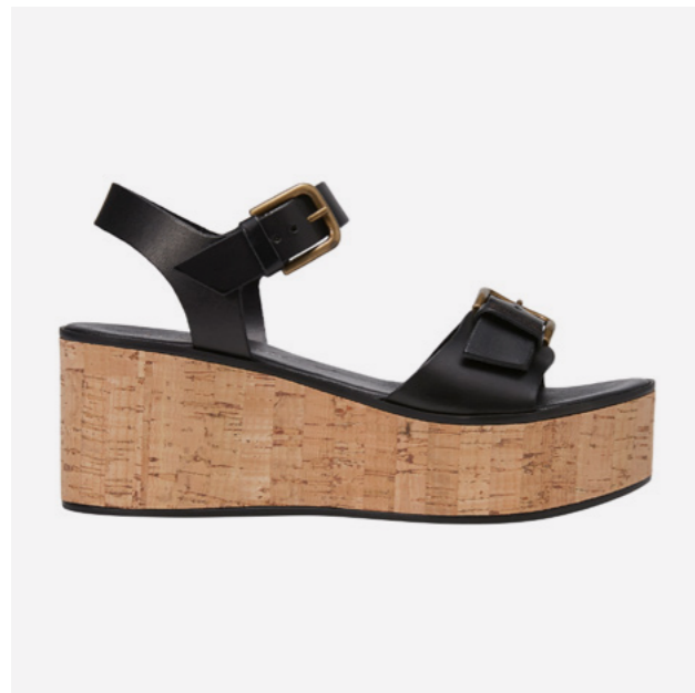
CLAUDIA 1A WEDGE SANDAL 104 16431401 107 / 990 black Sizes 36–42 RRP 119,95 €