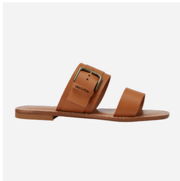
ORNELLA 5A FLAT SANDAL 104 16461105 103 / 720 coganc Sizes 36-42 RRP 99,95 €