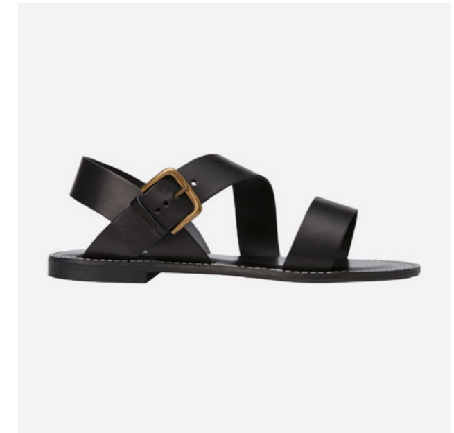
DALIA 1A FLAT SANDAL 104 16441101 107 / 990 black Sizes 36–42 RRP 99,95 €