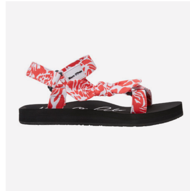
MONICA 1D BEACH SANDAL 104 16401001 612 / 348 red/white Sizes 36–42 RRP 49,95 €