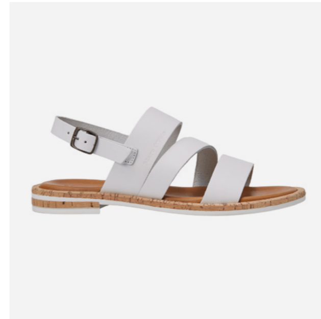
GENNY 1A FLAT SANDAL 104 16421101 107 / 100 white Sizes 36–42 RRP 89,95 €