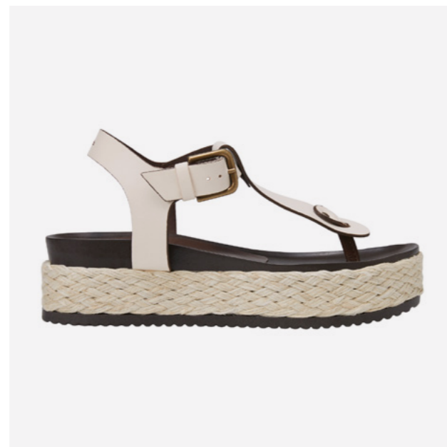
ILARIA 2A WEDGE SANDAL 104 16451402 107 / 110 offwhite Sizes 36–42 RRP 119,95 €