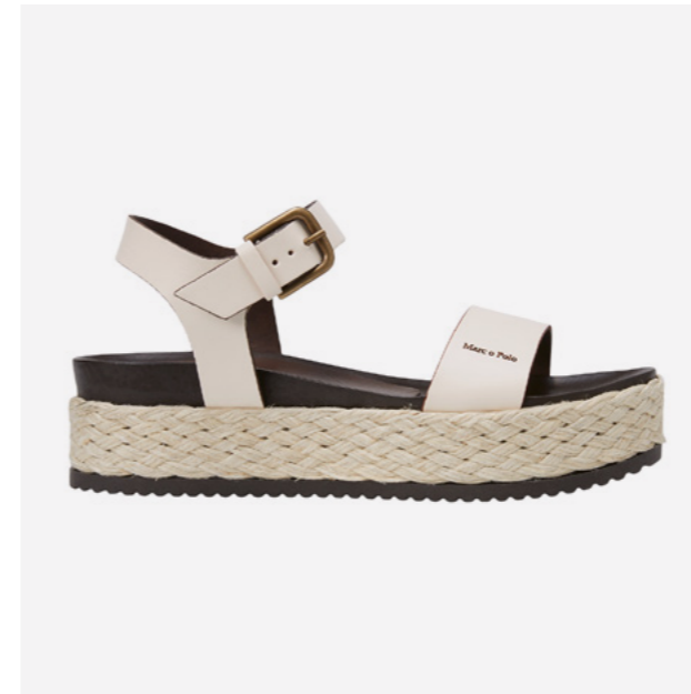
ILARIA 1A WEDGE SANDAL 104 16451401 107 / 110 offwhite Sizes 36–42 RRP 119,95 €