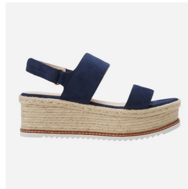
TROPEZ 2B ESPADRILLES 104 15631401 305 / 890 navy Sizes 36–42 RRP 99,95 €