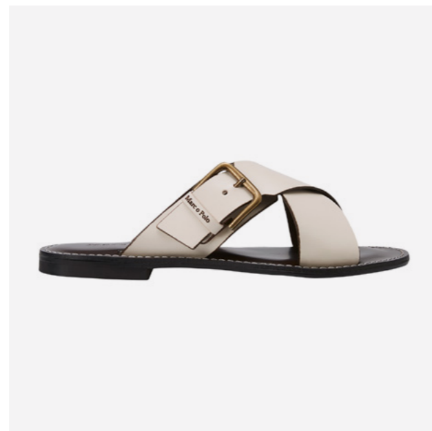
DALIA 2A FLAT SANDAL 104 16441102 107 / 110 offwhite Sizes 36–42 RRP 99,95 €