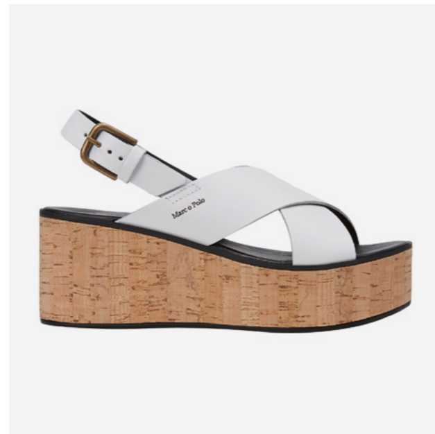
CLAUDIA 2A WEDGE SANDAL 104 16431402 107 / 100 white Sizes 36–42 RRP 119,95 €