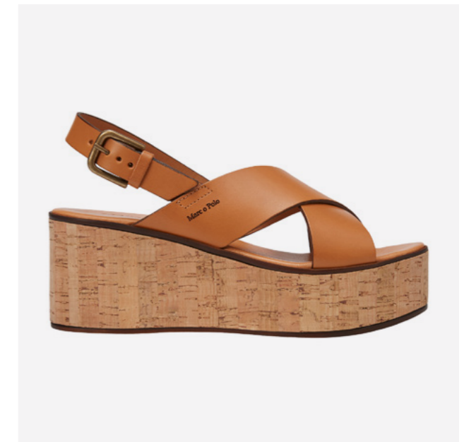
CLAUDIA 2A WEDGE SANDAL 104 16431402 107 / 720 cognac Sizes 36–42 RRP 119,95 €