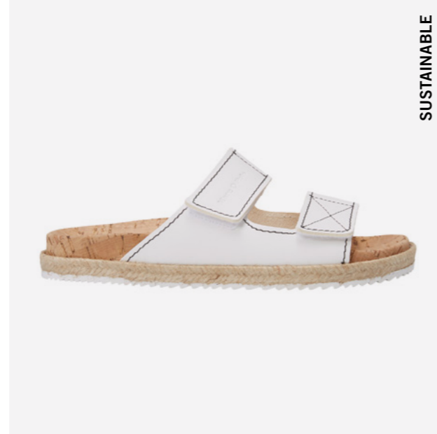
MARA 2A FLAT SANDAL 104 16501102 107 / 100 white Sizes 36–42 RRP 89,95 €