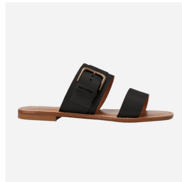
ORNELLA 5A FLAT SANDAL 104 16461105 103 / 990 black Sizes 36-42 RRP 99,95 €