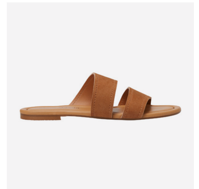
GIORGINA 2B FLAT SANDAL 104 16481104 305 / 720 cognac Sizes 36–42 RRP 59,95 €