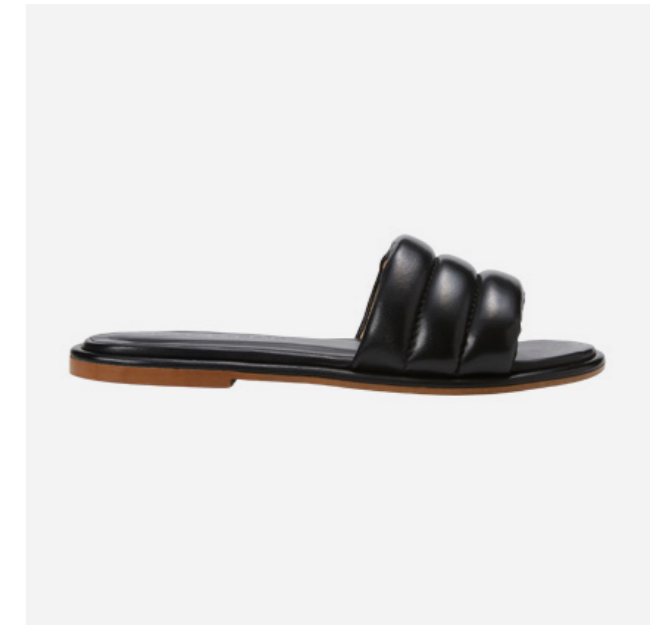
SABRINA 2A FLAT SANDAL 104 16381103 104 / 990 black Sizes 36–42 RRP 119,95 €