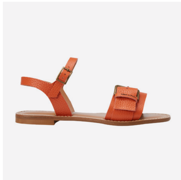
ORNELLA 3A FLAT SANDAL 104 16461103 103 / 277 orange Sizes 36–42 RRP 99,95 €