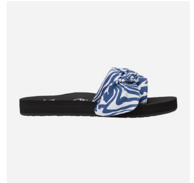
MONICA 3D BEACH SANDAL 104 16401003 612 / 854 blue/white Sizes 36–42 RRP 49,95 €