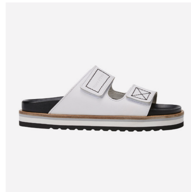
ANDREA 3A FLAT SANDAL 104 15761104 100 / 100 white Sizes 36–42 RRP 99,95 €