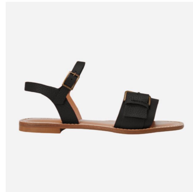
ORNELLA 3A FLAT SANDAL 104 16461103 103 / 990 black Sizes 36–42 RRP 99,95 €