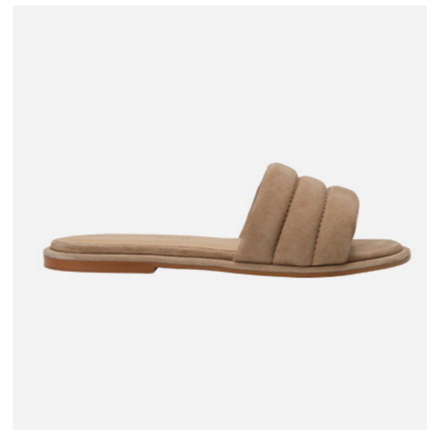
SABRINA 2B FLAT SANDAL 104 16381104 305 / 715 sand Sizes 36–42 RRP 119,95 €