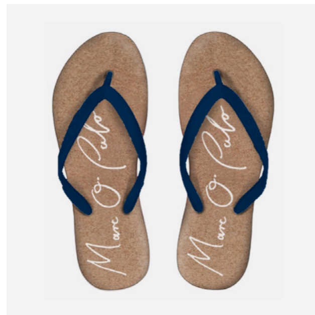
BECCO 2D CORK SANDAL 104 15901001 801 / 890 navy Double sizes 35/36 – 41/42 RRP 39,95 €