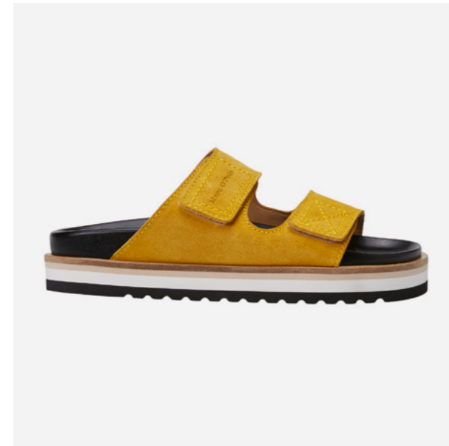
ANDREA 3B FLAT SANDAL 104 15761105 300 / 265 corn Sizes 36–42 RRP 99,95 €