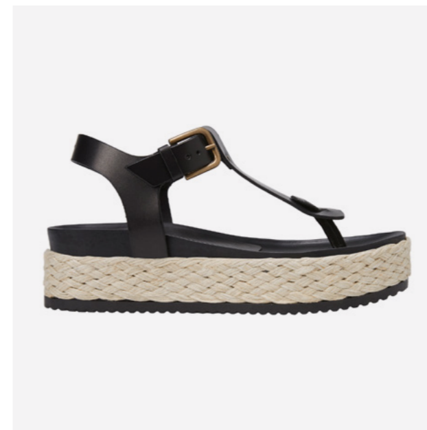
ILARIA 2A WEDGE SANDAL 104 16451402 107 / 990 black Sizes 36–42 RRP 119,95 €