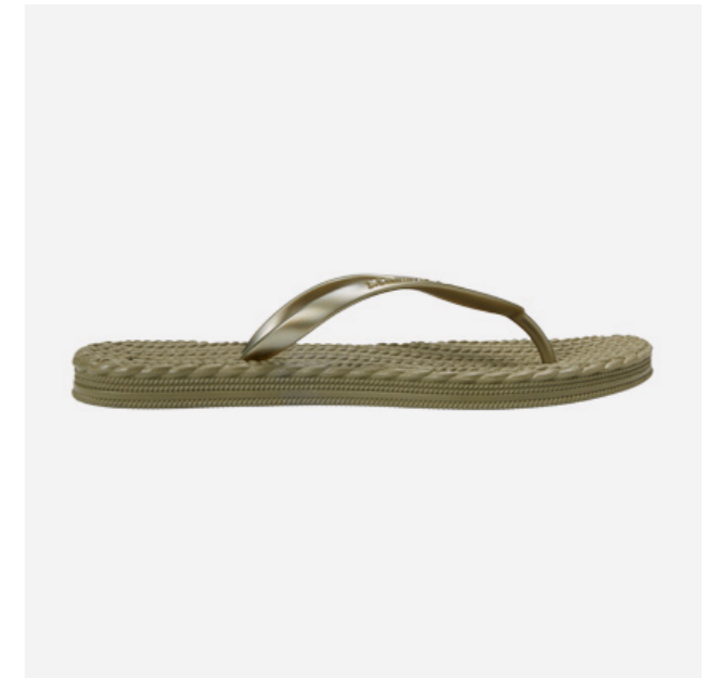
INA 1D BEACH SANDAL 104 16391001 609 / 410 khaki Sizes 36–42 RRP 29,95 €