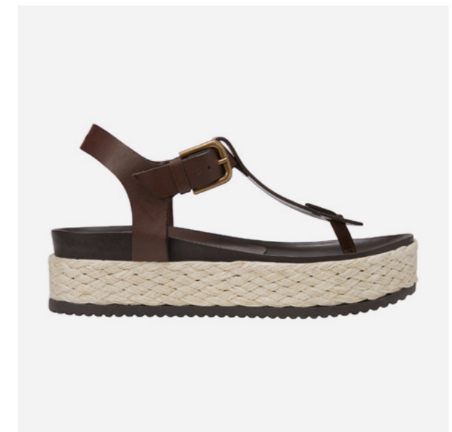
ILARIA 2A WEDGE SANDAL 104 16451402 107 / 790 dark brown Sizes 36–42 RRP 119,95 €