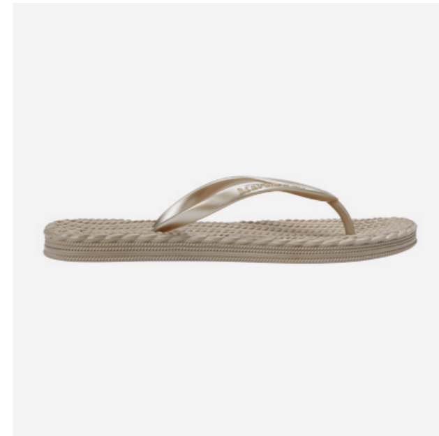
INA 1D BEACH SANDAL 104 16391001 609 / 717 taupe Sizes 36–42 RRP 29,95 €