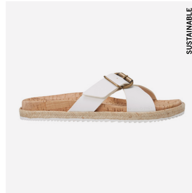
MARA 1A FLAT SANDAL 104 16501101 107 / 100 white Sizes 36–42 RRP 89,95 €