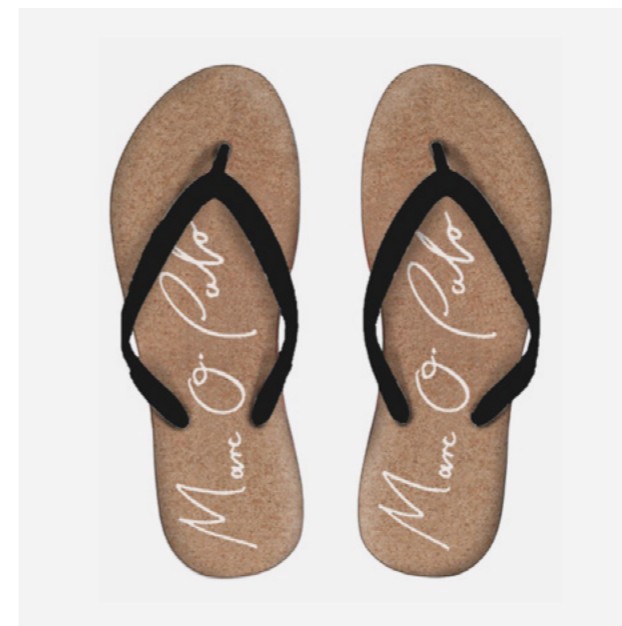
BECCO 2D CORK SANDAL 104 15901001 801 / 990 black Double sizes 35/36 – 41/42 RRP 39,95 €