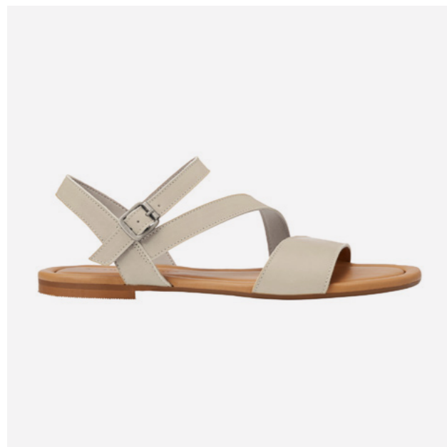
GIORGINA 1B FLAT SANDAL 104 16481102 305 / 715 sand Sizes 36–42 RRP 69,95 €