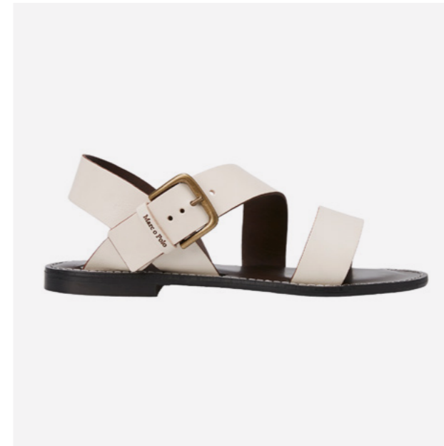
DALIA 1A FLAT SANDAL 104 16441101 107 / 110 offwhite Sizes 36–42 RRP 99,95 €