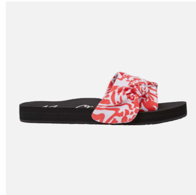
MONICA 3D BEACH SANDAL 104 16401003 612 / 348 red/white Sizes 36–42 RRP 49,95 €