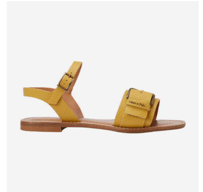
ORNELLA 3A FLAT SANDAL 104 16461103 103 / 265 corn Sizes 36–42 RRP 99,95 €