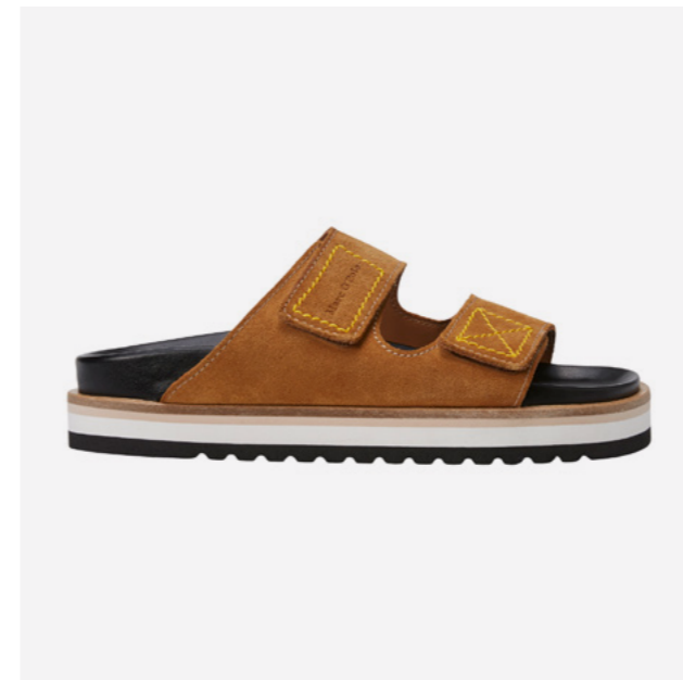
ANDREA 3B FLAT SANDAL 104 15761105 300 / 720 cognac Sizes 36–42 RRP 99,95 €