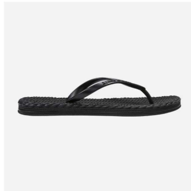
INA 1D BEACH SANDAL 104 16391001 609 / 990 black Sizes 36–42 RRP 29,95 €