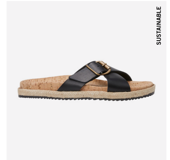
MARA 1A FLAT SANDAL 104 16501101 107 / 990 black Sizes 36–42 RRP 89,95 €