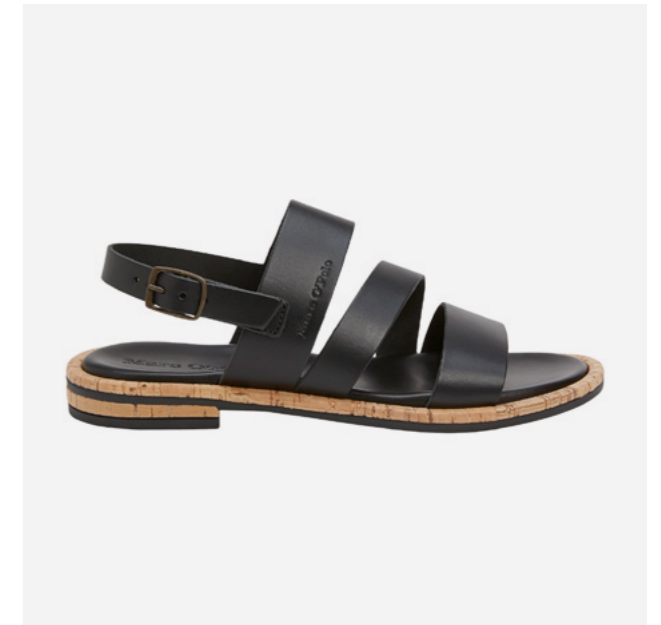
GENNY 1A FLAT SANDAL 104 16421101 107 / 990 black Sizes 36–42 RRP 89,95 €