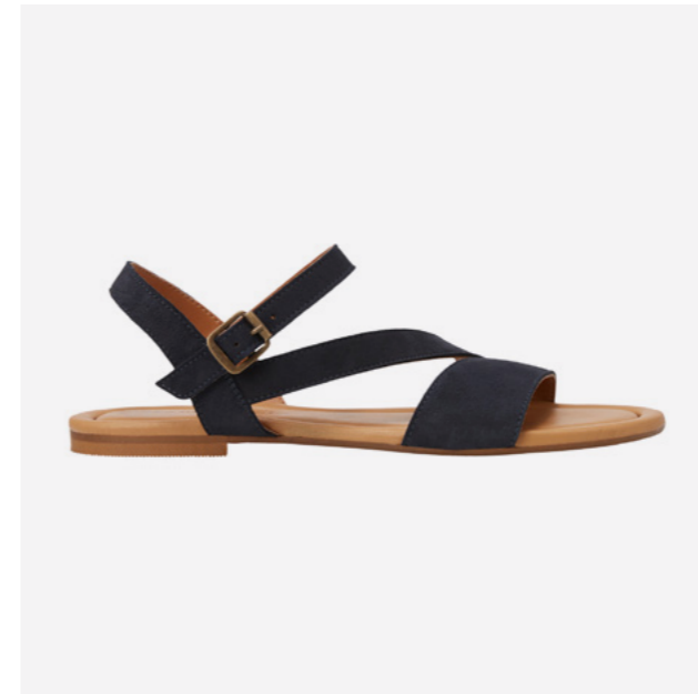
GIORGINA 1B FLAT SANDAL 104 16481102 305 / 890 navy Sizes 36–42 RRP 69,95 €