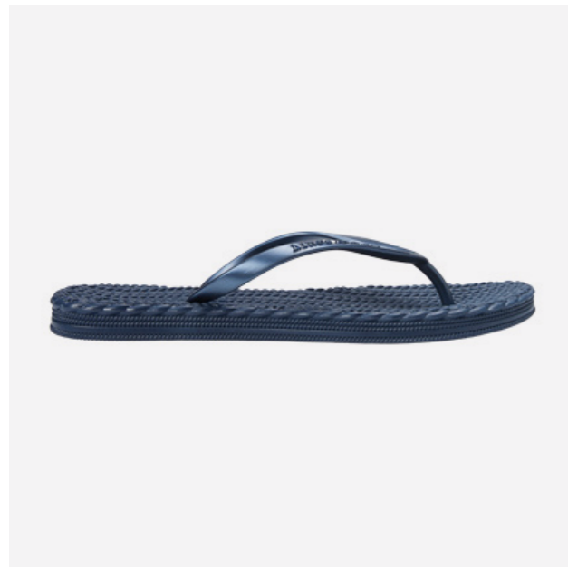
INA 1D BEACH SANDAL 104 16391001 609 / 850 blue Sizes 36–42 RRP 29,95 €