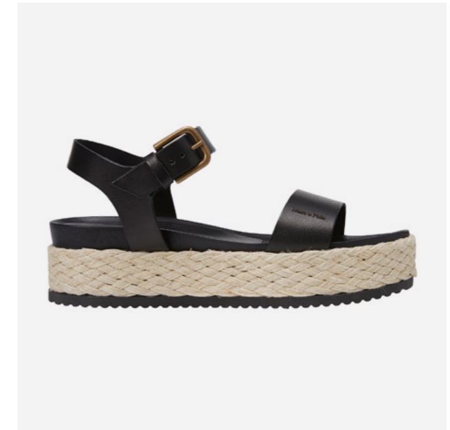
ILARIA 1A WEDGE SANDAL 104 16451401 107 / 990 black Sizes 36–42 RRP 119,95 €