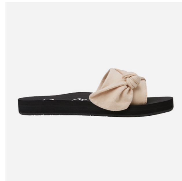
MONICA 3D BEACH SANDAL 104 16401003 612 / 715 sand Sizes 36–42 RRP 49,95 €