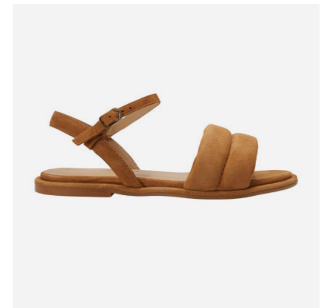
SABRINA 1B FLAT SANDAL 104 16381102 305 / 720 cognac Sizes 36–42 RRP 119,95 €