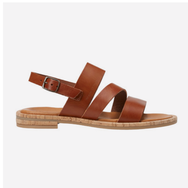
GENNY 1A FLAT SANDAL 104 16421101 107 / 720 cognac Sizes 36–42 RRP 89,95 €