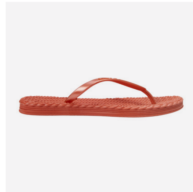
INA 1D BEACH SANDAL 104 16391001 609 / 281 burnt orange Sizes 36–42 RRP 29,95 €