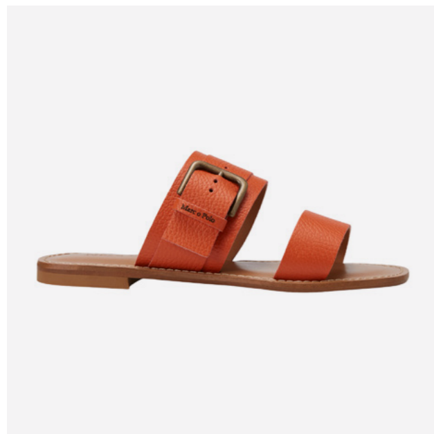
ORNELLA 5A FLAT SANDAL 104 16461105 103 / 277 orange Sizes 36-42 RRP 99,95 €