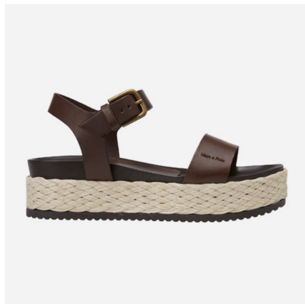
ILARIA 1A WEDGE SANDAL 104 16451401 107 / 790 dark brown Sizes 36–42 RRP 119,95 €