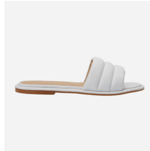
SABRINA 2A FLAT SANDAL 104 16381103 104 / 100 white Sizes 36–42 RRP 119,95 €