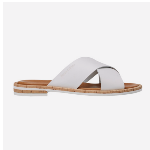
GENNY 2A FLAT SANDAL 104 16421102 107 / 100 white Sizes 36–42 RRP 79,95 €