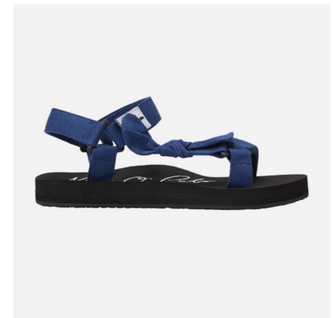
MONICA 1D BEACH SANDAL 104 16401001 612 / 850 blue Sizes 36–42 RRP 49,95 €