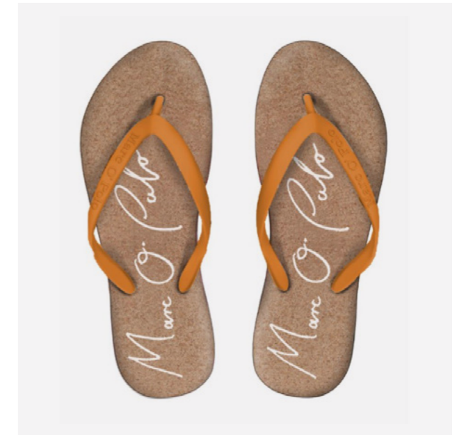
BECCO 2D CORK SANDAL 104 15901001 801 / 277 orange Double sizes 35/36 – 41/42 RRP 39,95 €