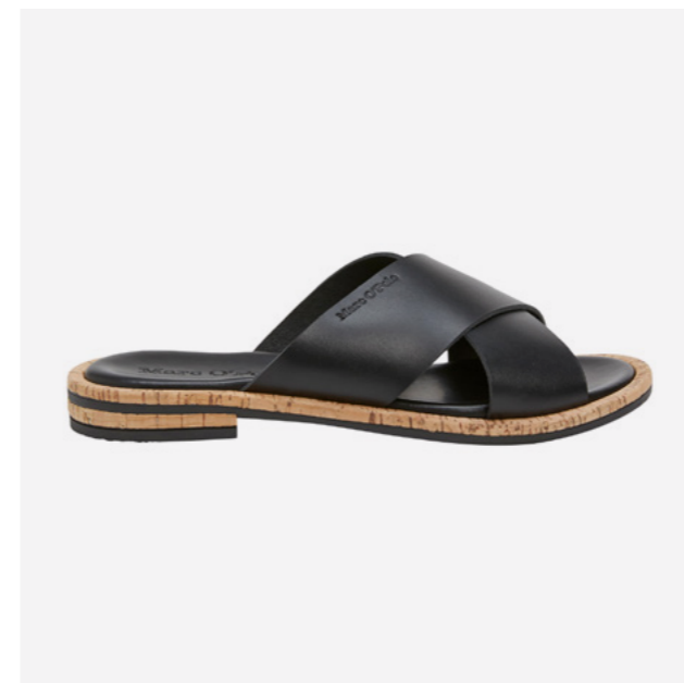
GENNY 2A FLAT SANDAL 104 16421102 107 / 990 black Sizes 36–42 RRP 79,95 €