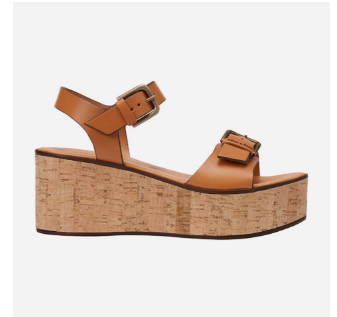
CLAUDIA 1A WEDGE SANDAL 104 16431401 107 / 720 cognac Sizes 36–42 RRP 119,95 €