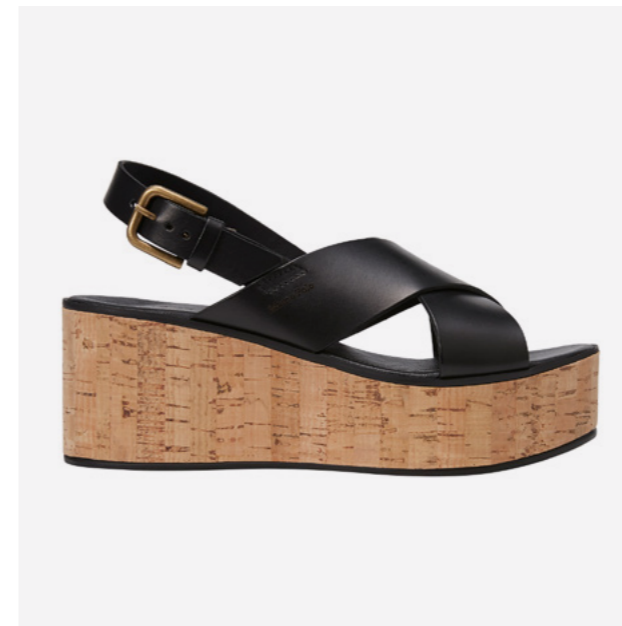
CLAUDIA 2A WEDGE SANDAL 104 16431402 107 / 990 black Sizes 36–42 RRP 119,95 €