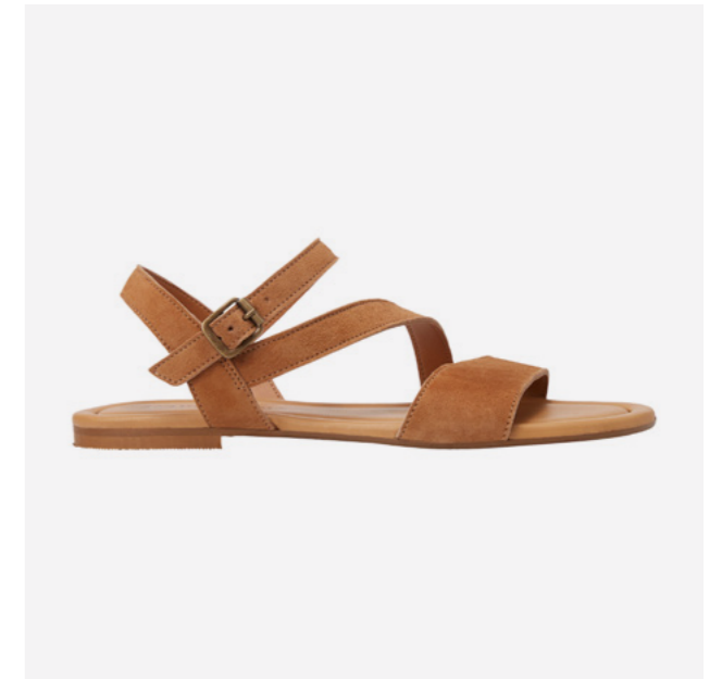
GIORGINA 1B FLAT SANDAL 104 16481102 305 / 720 cognac Sizes 36–42 RRP 69,95 €