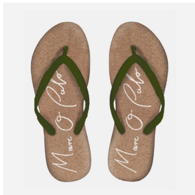
BECCO 2D CORK SANDAL 104 15901001 801 / 410 khaki Double sizes 35/36 – 41/42 RRP 39,95 €