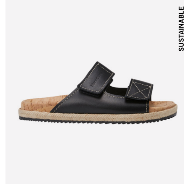
MARA 2A FLAT SANDAL 104 16501102 107 / 990 black Sizes 36–42 RRP 89,95 €