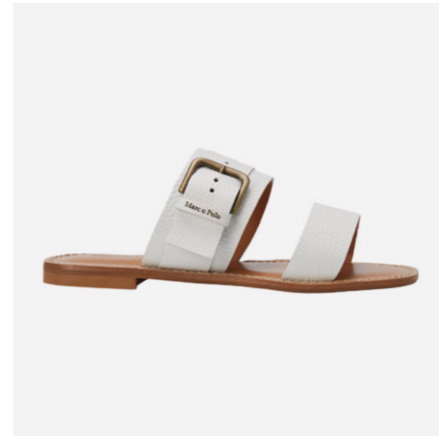
ORNELLA 5A FLAT SANDAL 104 16461105 103 / 100 white Sizes 36-42 RRP 99,95 €