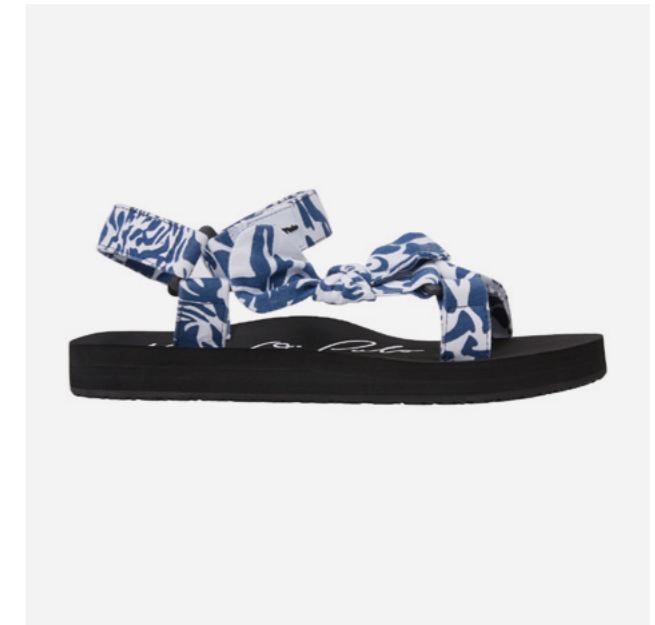
MONICA 1D BEACH SANDAL 104 16401001 612 / 854 blue/white Sizes 36–42 RRP 49,95 €