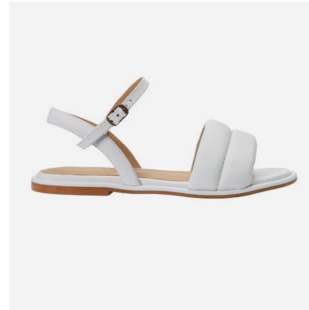
SABRINA 1A FLAT SANDAL 104 16381101 104 / 100 white Sizes 36–42 RRP 119,95 €