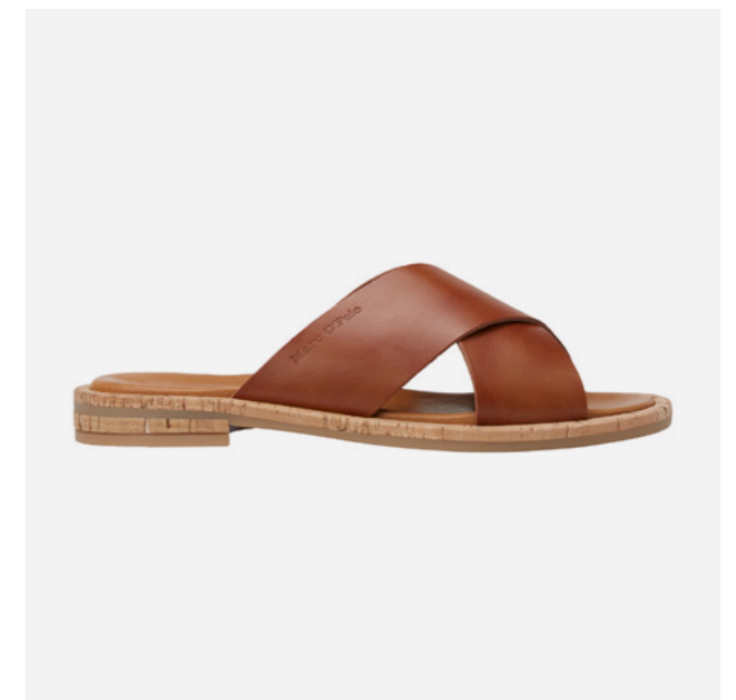
GENNY 2A FLAT SANDAL 104 16421102 107 / 720 cognac Sizes 36–42 RRP 79,95 €