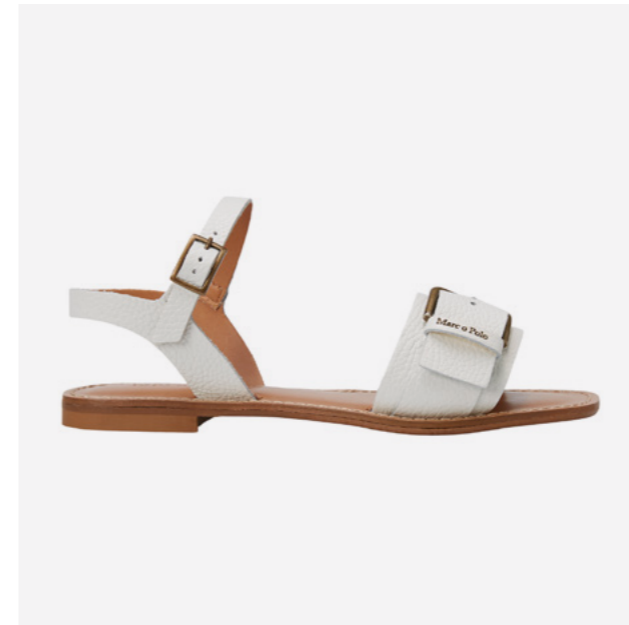
ORNELLA 3A FLAT SANDAL 104 16461103 103 / 100 white Sizes 36–42 RRP 99,95 €