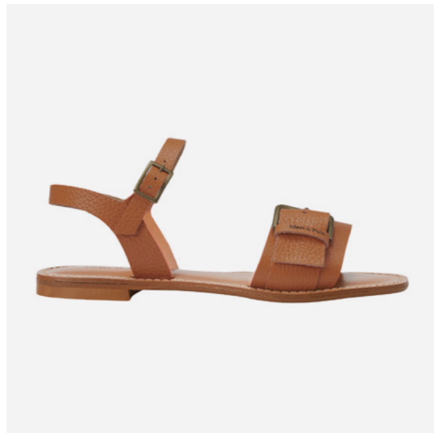
ORNELLA 3A FLAT SANDAL 104 16461103 103 / 720 cognac Sizes 36–42 RRP 99,95 €