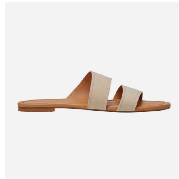
GIORGINA 2B FLAT SANDAL 104 16481104 305 / 715 sand Sizes 36–42 RRP 59,95 €