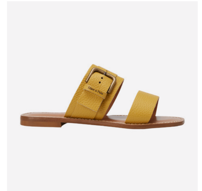
ORNELLA 5A FLAT SANDAL 104 16461105 103 / 265 corn Sizes 36-42 RRP 99,95 €