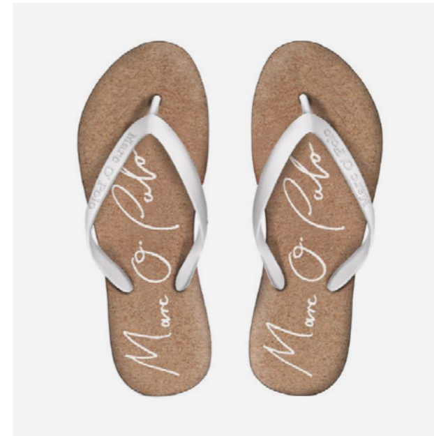
BECCO 2D CORK SANDAL 104 15901001 801 / 110 offwhite Double sizes 35/36 – 41/42 RRP 39,95 €