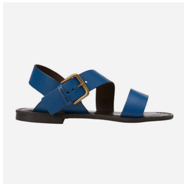
DALIA 1A FLAT SANDAL 104 16441101 107 / 850 blue Sizes 36–42 RRP 99,95 €