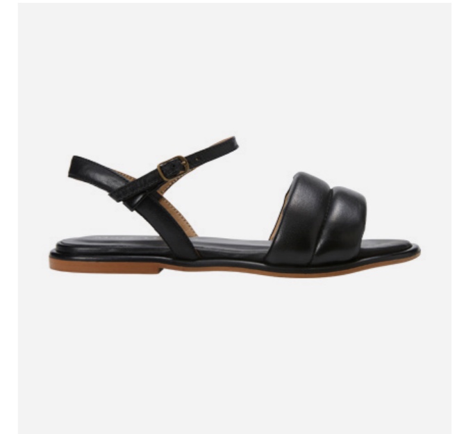
SABRINA 1A FLAT SANDAL 104 16381101 104 / 990 black Sizes 36–42 RRP 119,95 €