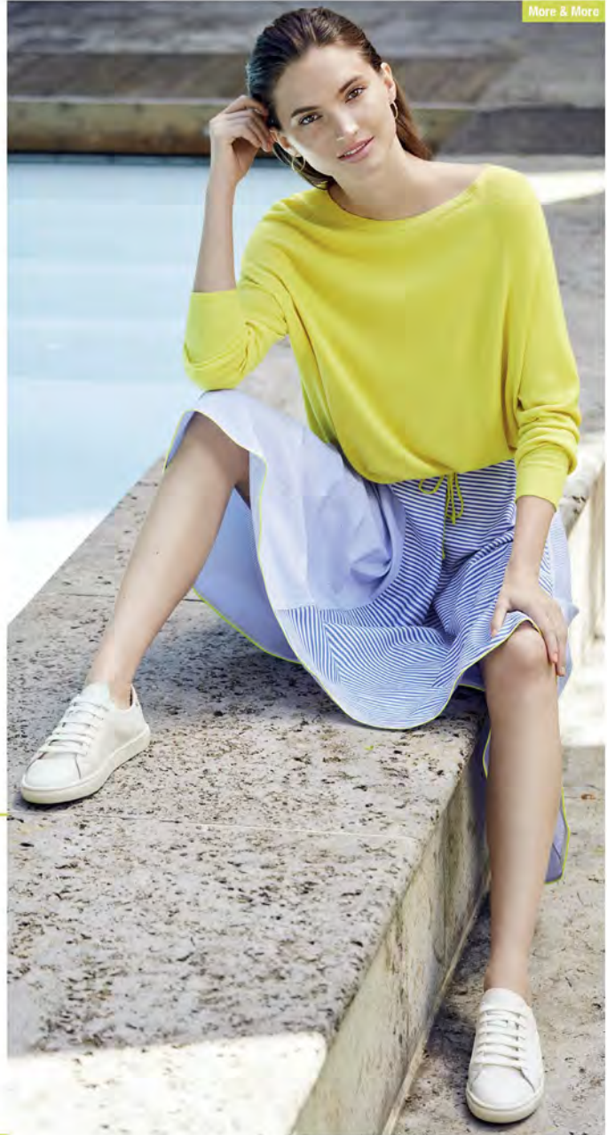
More & More